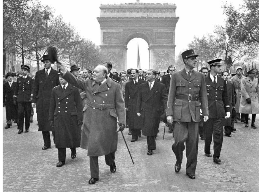
W. Churchillis kartu su Ch. de Gaulle'iu žengia išvaduooto Paryžiaus gatvėmis. 1944 m. lapkričio 11 d.