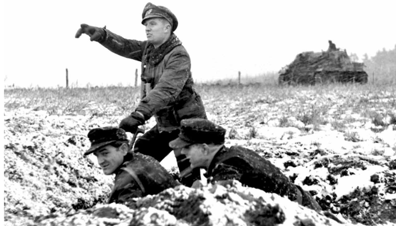
Ardėnų operacija. Vokiečių 217-ojo šarvuotojo bataliono kariškiai žvalgo vietovę.

O dabar artinosi baisus smūgis. Po šešių dienų nuo šios telegramos išsiuntimo mus ištiko krizė. Sąjungininkų sprendimas smarkiai veržtis pirmyn iš šiaurėje esančio Acheno ir per Alzasą pietuose susilpnino mūsų centrą. Ardėnų sektoriuje 120 km frontą gynė vienintelis VIII amerikiečių korpusas, sudarytas iš keturių divizijų. Ši rizika buvo numatyta, sąmoningai nuspręsta jos nepaisyti, tačiau padariniai buvo tragiški, ir viskas galėjo baigtis dar liūdniau. Stulbinamomis pastangomis priešas Vakarų fronte sugebėjo sutelkti 70 divizijų, 15 iš jų buvo šarvuotosios. Daugelis jų buvo netekusios daug karių, pervargusios, išbaigusios šaudmenis, bet viena formuotė – 6-oji tankų armija – buvo stipri ir geros būklės. Šį galimai priešakinį būrį atidžiai stebėjome, kol jis stovėjo rezerve į rytus nuo Acheno. Kai gruodžio pradžioje kovos tame fronto ruože prislopo, ši armija kurį laiką dingo iš mūsų žvalgybos akiračio, o skraidyti netinkamas oras trukdė sekti padėti. Eisenhoweris įtarė, kad rengiama kažkas negera, bet puolimo mastas ir jėga buvo netikėti.