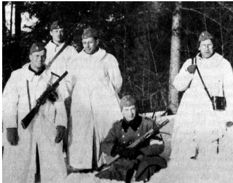
Baltarusijoje veikiantys latvių 321-ojo pagalbinės policijos bataliono kariai.

Pagrindinė priežastis, kodėl buvo daug latviškų batalionų ir daug latvių, tarnaujančių juose, buvo Didžiosios Vokietijos aukščiausiojo SS ir policijos viršininko Heinricho Himmlerio 1941 m. spalio 13 d. raštiškas potvarkis dėl latvių dalinių, kurie galėtų būti panaudoti kovai su bolševikų partizanais arba Raudonąja armija už Latvijos teritorijos ribų, kūrimo: „1. Legiono niekada. 2. Policijos dalinių labai daug.“ Ši Himmlerio nuostata atitiko tuometinį Hitlerio ir nacionalsocialistų partijos viršūnėlės požiūrį, kad Vokietija kare laimės viena savo jėgomis ir kad okupuotų rytinių kraštų vyrams negalima duoti į rankas tiek ginklų,