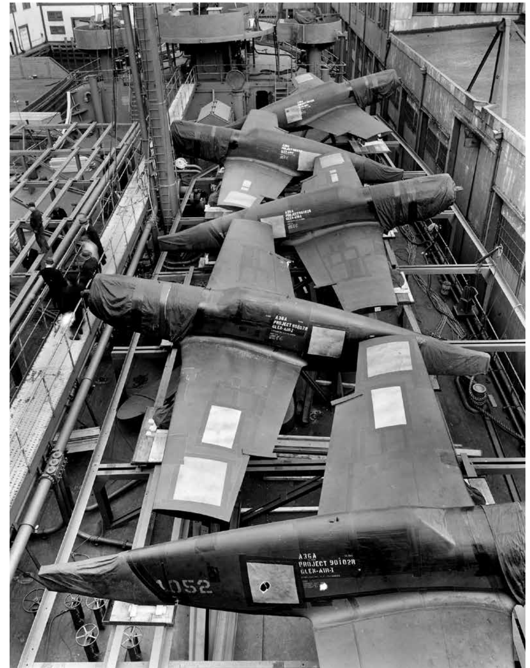
Pagal lendlizo programą laivais plukdomi lėktuvai galutinai būdavo surenkami paskirties vietoje.

Tam, kad būtų vykdomas Pirmojo protokolo grafikas, kariuomenė kovo mėnesį iš amerikiečių tankistų rekvizavo visus benzinu varomus