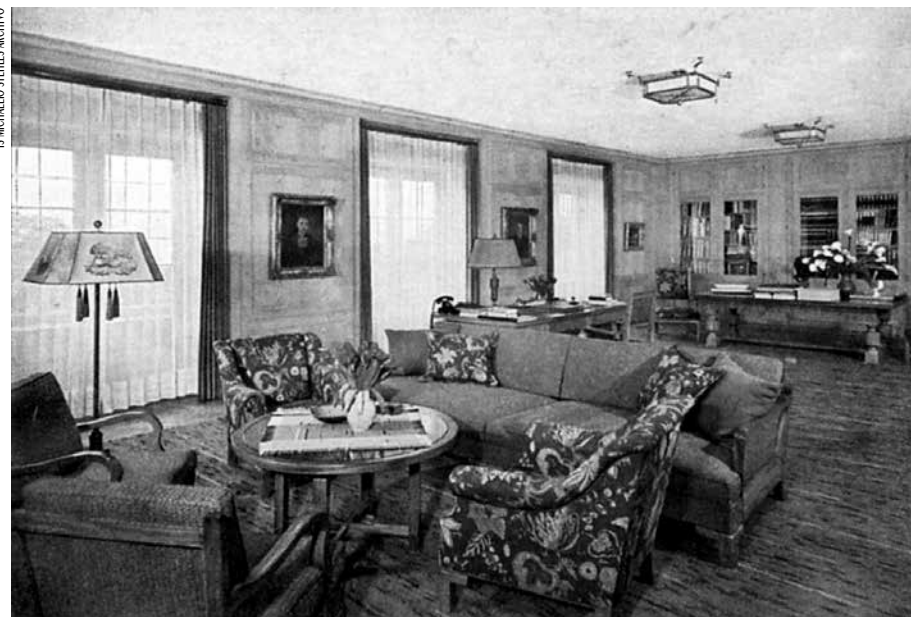
Hitlerio darbo kambarys Oberzalcburge (Berghofe).