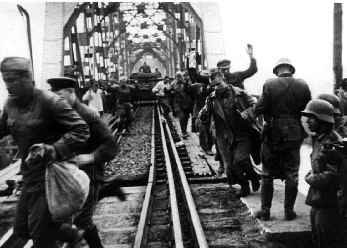
Į nelaisvę patekusius raudonarmiečius vokiečiai veda į užnugarį per Bresto geležinkelio tiltą. 1941 m. birželis.