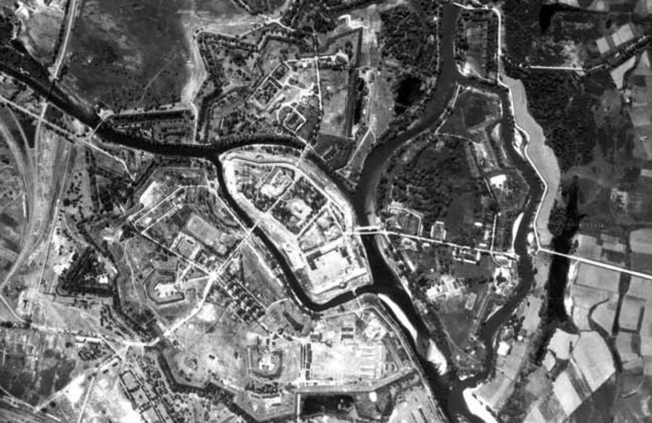
1940 m. Bresto tvirtovės aeronuotrauka.

padalinta į keturias nedideles salas. Krūmuose ir tarp medžių slėpėsi gerai užmaskuoti kazematai, snaperių apkasai, sukiojamieji šarvuoti bokšteliai su prieštankiniais ir priešlėktuviniais pabūklais. Birželio 22 d. Breste iš viso buvo dislokuoti penki Raudonosios armijos pulkai, įskaitant du artilerijos pulkus, vieną žvalgybos batalioną, vieną savarankišką priešlėktuvinės artilerijos padalinį, tiekimo batalioną ir karo medikų batalioną.