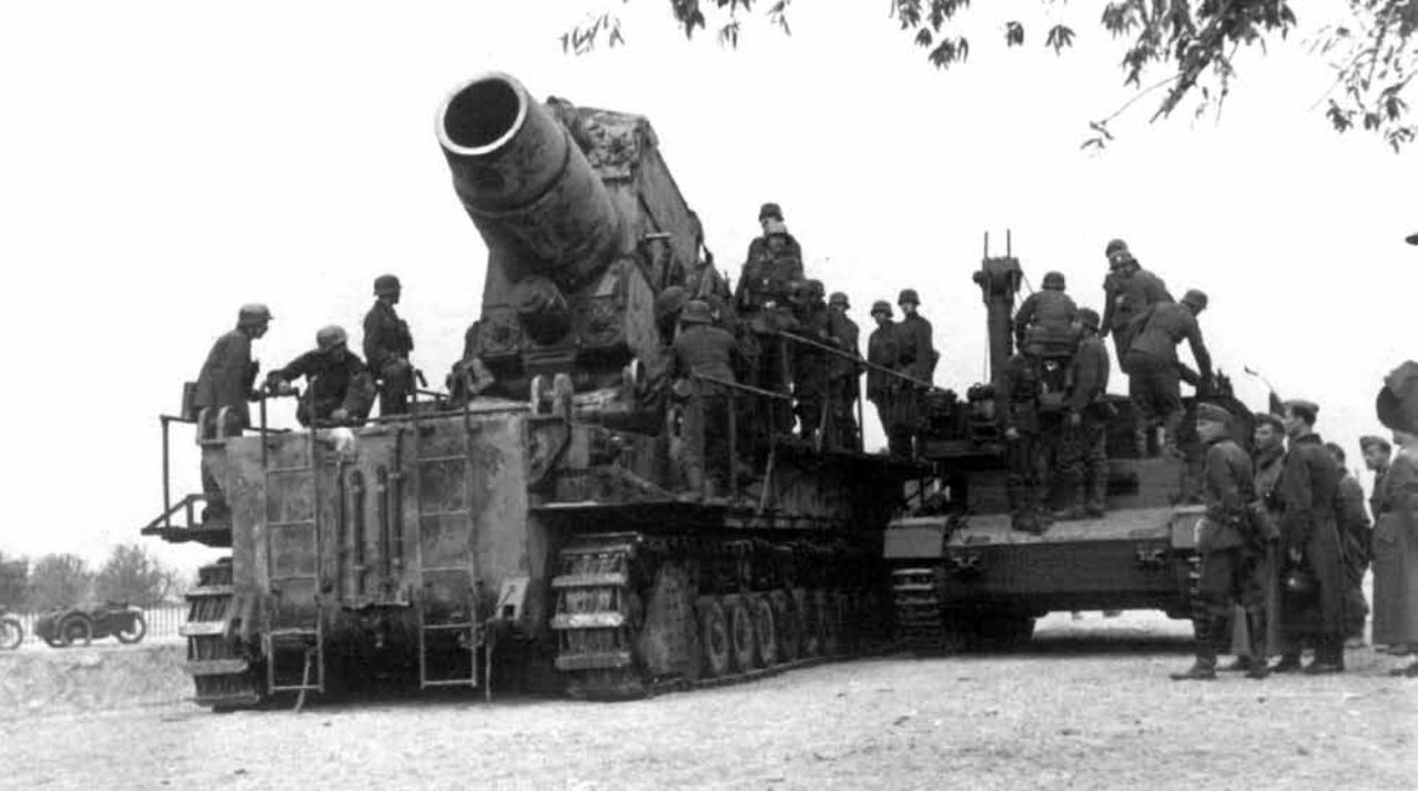
Bresto tvirtovei apšaudyti buvo pasitelkta ir sunkiasvorė 600 mm savaeigė mortyra „Karl“.

divizijos paėmė į nelaisvę 7000 rusų kareivių, tarp kurių buvo 100 karininkų. Vokiečių pusėje žuvo 482 žmonės, iš kurių 40 buvo karininkai. Dar per 1000 žmonių buvo sužeista, daugelis sužeistųjų netrukus mirė. Apie vokiečių patirtus nuostolius galima spręsti iš to, kad iki birželio 30-osios Rytų fronte iš viso žuvo 8886 Vermachto kariai. Taigi, Bresto tvirtovės šturmui teko daugiau kaip 5 proc. visų per pirmąjį karo savaitę kritusių Vermachto karių.