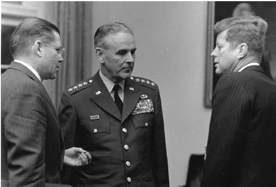
Prezidentas J. F. Kennedy'is (dešinėje) 1962 m. Baltuosiuose rūmuose kalbasi su gynybos sekretoriumi Robertu McNamara ir Jungtinių štabų vadų pirmininku generolu Maxwello D. Tayloru. Amerikos generolai troško invazijos į Kubą ir net galimas taktinių branduolinių ginklų buvimas saloje neprivertė jų būti atsargius.