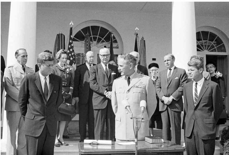
Naujojo Jungtinių štabų vadų pirmininko generolo Maxwello D. Tayloro priesaikos ceremonija 1962 m. spalio 1 d. Per visą krizę padedamas JFK generolo sugebėjo kontroliuoti kariškius. Dešinėje – generalinis prokuroras Robertas Kennedy'is, ištikimas brolio leitenantas ir pagrindinė figūra per krizę.