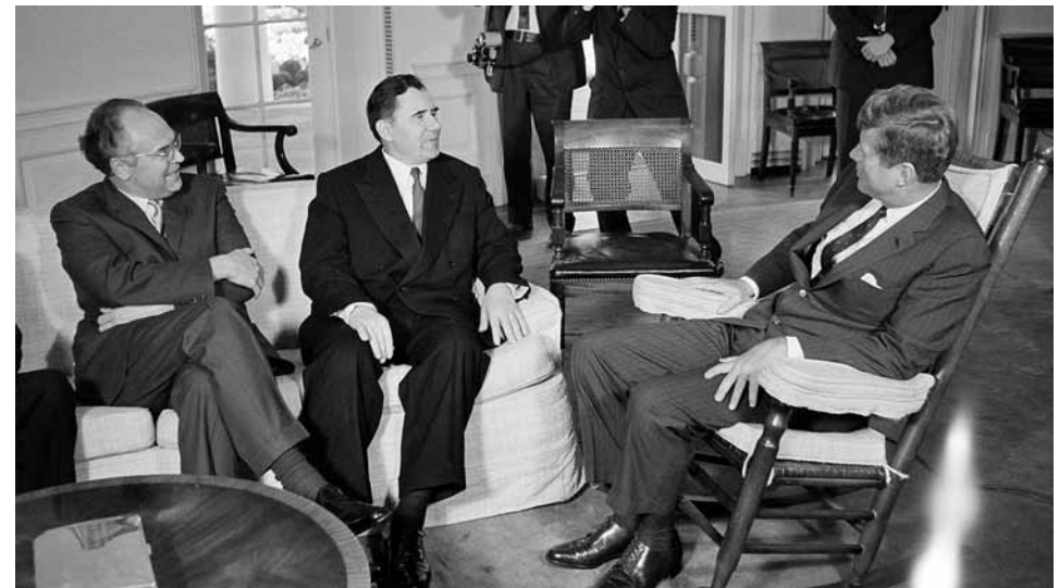
SSRS užsienio reikalų ministras Andrejus Gromyka ir Sovietų Sąjungos ambasadorius JAV Anatolijus Dobryninas per susitikimą Baltuosiuose rūmuose 1962 m. spalio 18 d. bando įtikinti JAV prezidentą Johną F. Kennedy'į (dešinėje), kad Kuboje nėra sovietų puolamųjų ginklų. Kennedy'is per susitikimą neprisitarė apie aptiktas raketas, nors jau ruošė karinių oro pajėgų smūgi sovietų bazėms.