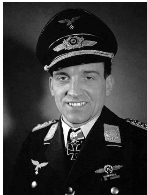
Hansas Ulrichas Rudelis – aukščiausias apdovanojimus gavęs Trečiojo reicho oro asas.

Tarp lakūnų, bombardavusių sovietų ugnies pozicijas palei Belgorodo–Obojanės kelią priešais SS tankų korpuso kovos mašinas, buvo lakūnas, kurio vardą puikiai žinojo abiejose fronto pusėse – Hansas Ulrichas Rudelis. Su „Stuka“ jis visada atsirasdavo pačiame įvykių sūkurioje.