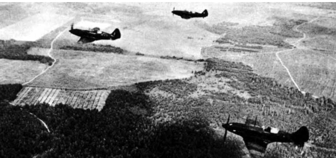
Sovietų naikintuvų MiG-3 eskadrilė virš Kijevo.

matmenį ir taip pasmerks jų puolimą Kursko pietiniame fronte dar iki tol, kol pirmasis vokiečių pėstininkas iššoks iš blindazo.