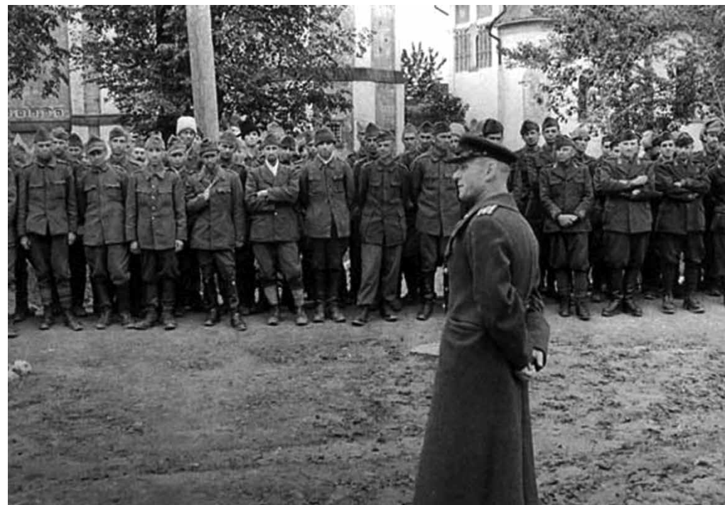
Iškart po karo į Vokietiją leista išvykti tik patiems ištikimiausiems sovietų pagalbininkams.

Demoralizuojantis bado poveikis, politinių vadovų ir komunistų emigrantų korupcijos metodai lageriuose, privilegijuota mūsų namo gyventojų ir komiteto delegacijos padėtis taip neišardomai susiejo gryną savisaugos instinktą su prisijungimu prie nacionalinio komiteto, kad kartais jau nežinai, ar ir kiek tave patį tai veikia ar veikė, net jei prisijungei prie antifašistinės grupės lageryje tokiu metu ir tokiomis aplinkybėmis, kai apie bet kokią galimą naudą iš to negalėjo būti nė kalbos. Bet kuriuo atveju tave, kaip ir kitus, nuolatos kamuoja nešvari sąžinė, kurios nepripažįsti. Kol vyko karas ir į visa tai galėjau žiūrėti kaip į neišvengiamą dėl aplinkybių blogį