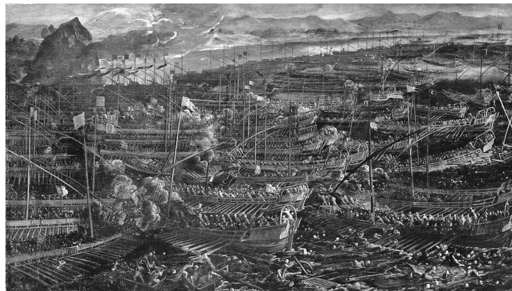
Galerų kautynės. Jacopo Tintoretto paveikslas. XVI a.