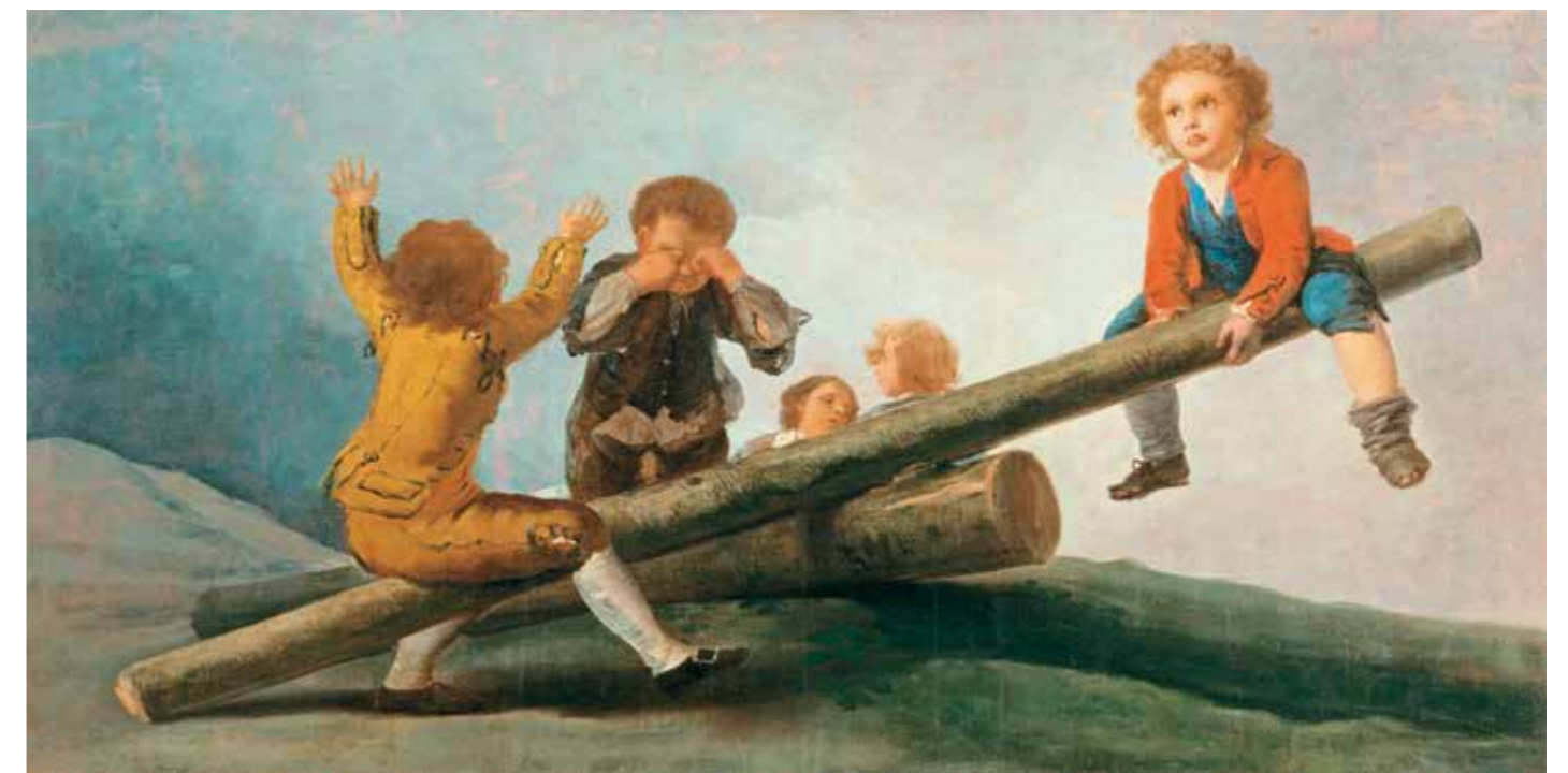
Supimosi lenta, 1791–1792 m., aliejus ant drobės, Filadelfijos meno muziejus, Pensilvanija, JAV, 82,4 cm x 163,2 cm

Du jaunuoliai ant kojūkų artinasi prie lango, pro kurį pasilenkusi jauna moteris. Juos pėsčiomis lydi dar du jaunuoliai, grojantys dulzainomis (į obojų panašiais instrumentais). Reginį stebi būrelis žiūrovų. Kaip ir visi kiti Gojos gobelenų projektai Karolio IV kabinetui Eskorialyje, šis irgi turi slaptą prasmę. Įspėjama, kad Ispanija turi atsargiai žvelgti į Europoje vykstančius neramumus.