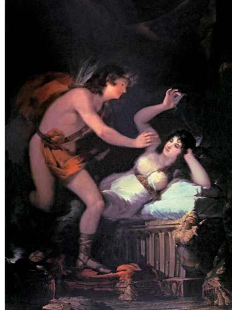
Kupidonas ir Psichė , apie 1798–1805 m., Katalonijos nacionalinis dailės muziejus, Barselona, Ispanija, 220,5 cm x 155,5 cm

Toks Gojos originalumas padarė didžiulę įtaką vėlesniems dailininkams.