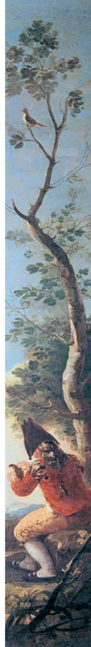
Berniukas su paukščiu, 1779–1780 m., aliejus ant drobės, Nacionalinis Prado muziejus, Madridas, Ispanija, 262 cm x 40 cm

Mažas berniukas, nugarą atsisukęs į žiūrovą, glosto dagilį, tupintį ant rankos. Aukšto medžio viršūnėje – dar vienas dagilis. Šis ryškių spalvų gobelenas turėjo