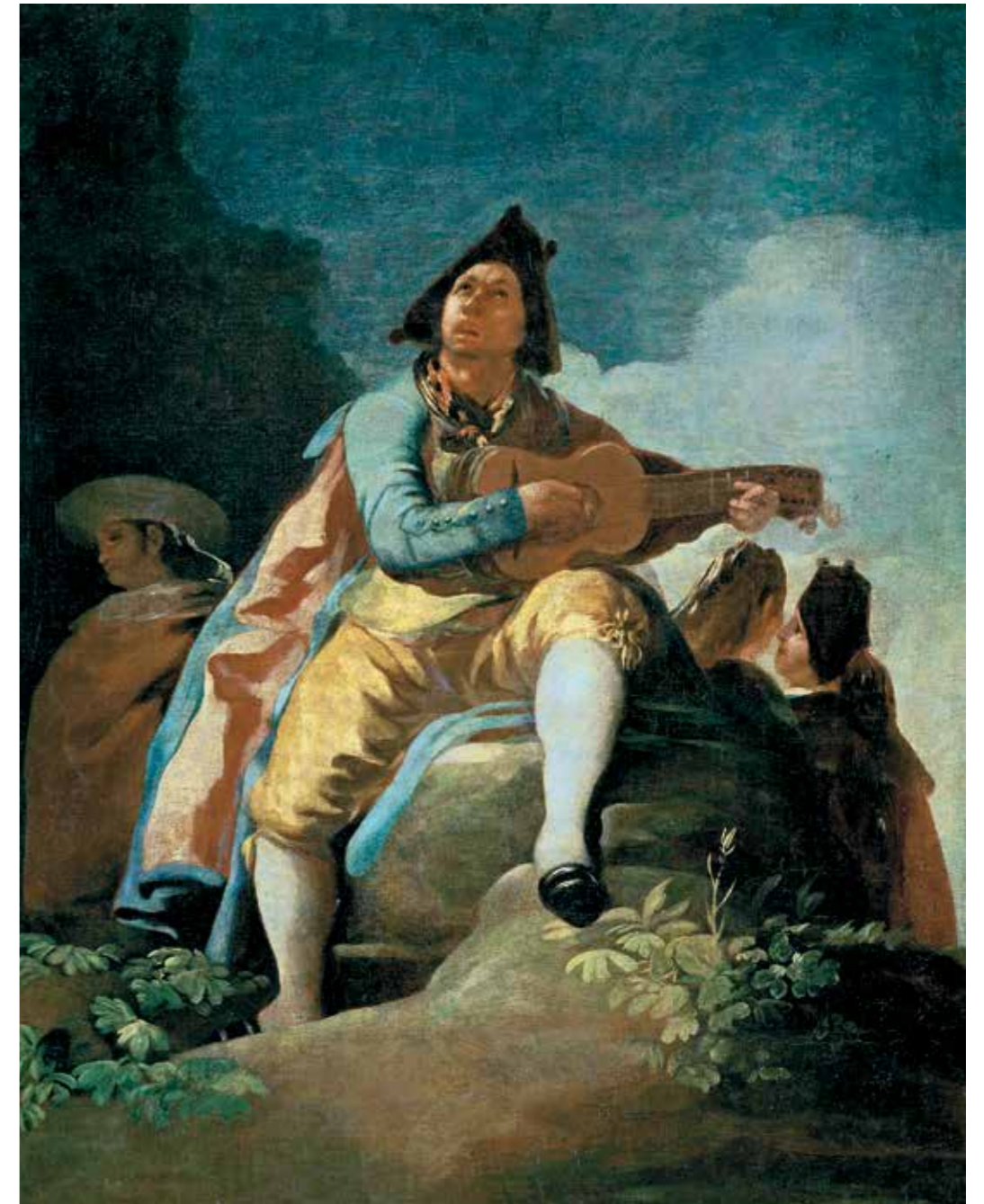
Machas su gitara, 1779 m., aliejus ant drobės, Nacionalinis Prado muziejus, Madridas, Ispanija, 137 cm x 12 cm

kabėti siauroje erdvėje, štai kodėl jo forma tokia ilga ir vertikali – tai buvo vienas iš Gojos iššūkių, kuriant tokius kartonus.