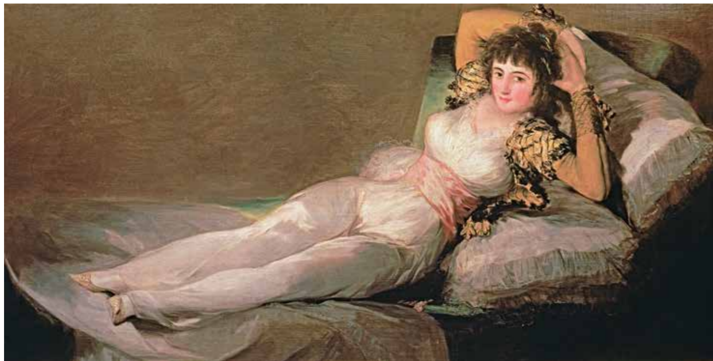
Apsirengusi macha , 1797–1800 m., aliejus ant drobės, Nacionalinis Prado muziejus, Madridas, Ispanija, 95 cm x 190 cm

Tudo. 1815 metais inkvizicija iškvietė Goją pasiaiškinti, kas gi užsakė šį paveikslą, bet jo atsakymas nežinomas.