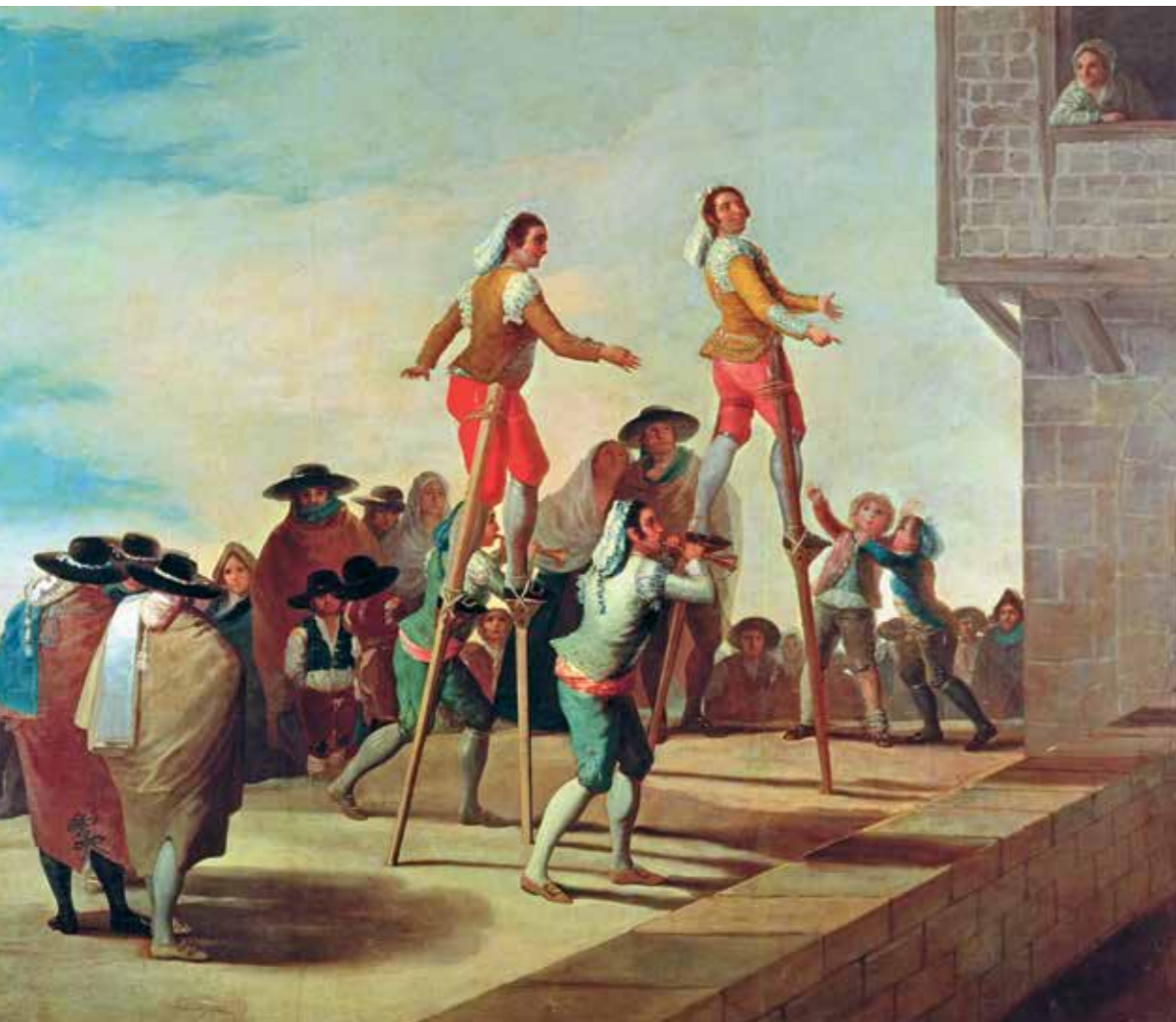
Kojūnai, 1791–1792 m., Nacionalinis Prado muziejus, Madridas, Ispanija, 268 cm x 320 cm

Du jaunuoliai ant kojūkų artinasi prie lango, pro kurį pasilenkusi jauna moteris. Juos pėsčiomis lydi dar du jaunuoliai, grojantys dulzainomis (į obojų panašiais instrumentais). Reginį stebi būrelis žiūrovų. Kaip ir visi kiti Gojos gobelenų projektai Karolio IV kabinetui Eskorialyje, šis irgi turi slaptą prasmę. Įspėjama, kad Ispanija turi atsargiai žvelgti į Europoje vykstančius neramumus.