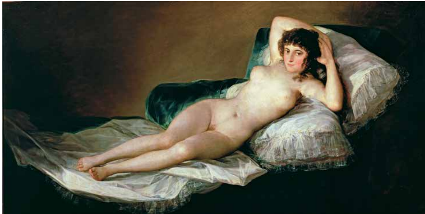
Nuoga macha , 1797–1800 m., aliejus ant drobės, Nacionalinis Prado muziejus, Madridas, Ispanija, 98 cm x 191 cm

Moters aktas – retenybė ispanų mene, tačiau Goja šios temos ėmėsi provokuojamai ir nenuolaidžiai. Tai pirmas paveikslas, kuriame vaizduojami gaktos plaukai –