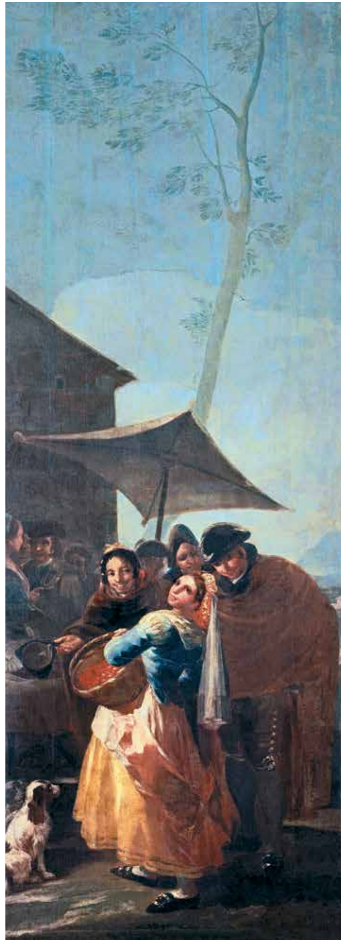
Vyšnių pardavėja, 1779 m., aliejus ant drobės, Nacionalinis Prado muziejus, Madridas, Ispanija, 259 cm x 100 cm

Moteris, apsirengusi kaip macha, nusišuka nuo būrelio žmonių su apsiaustais ir flirtuodama žvelgia į žiūrovą. Čia vaizduojama kasdienė turgaus scena Madride, nors vyrai labiau susidomėję jauna moterimi, o ne jos uogų krepšeliu. Nors kūrybą ribojo rūmų menių formos, kur turėjo kabėti gobelenai, Gojos sprendimai labai kūrybingi.