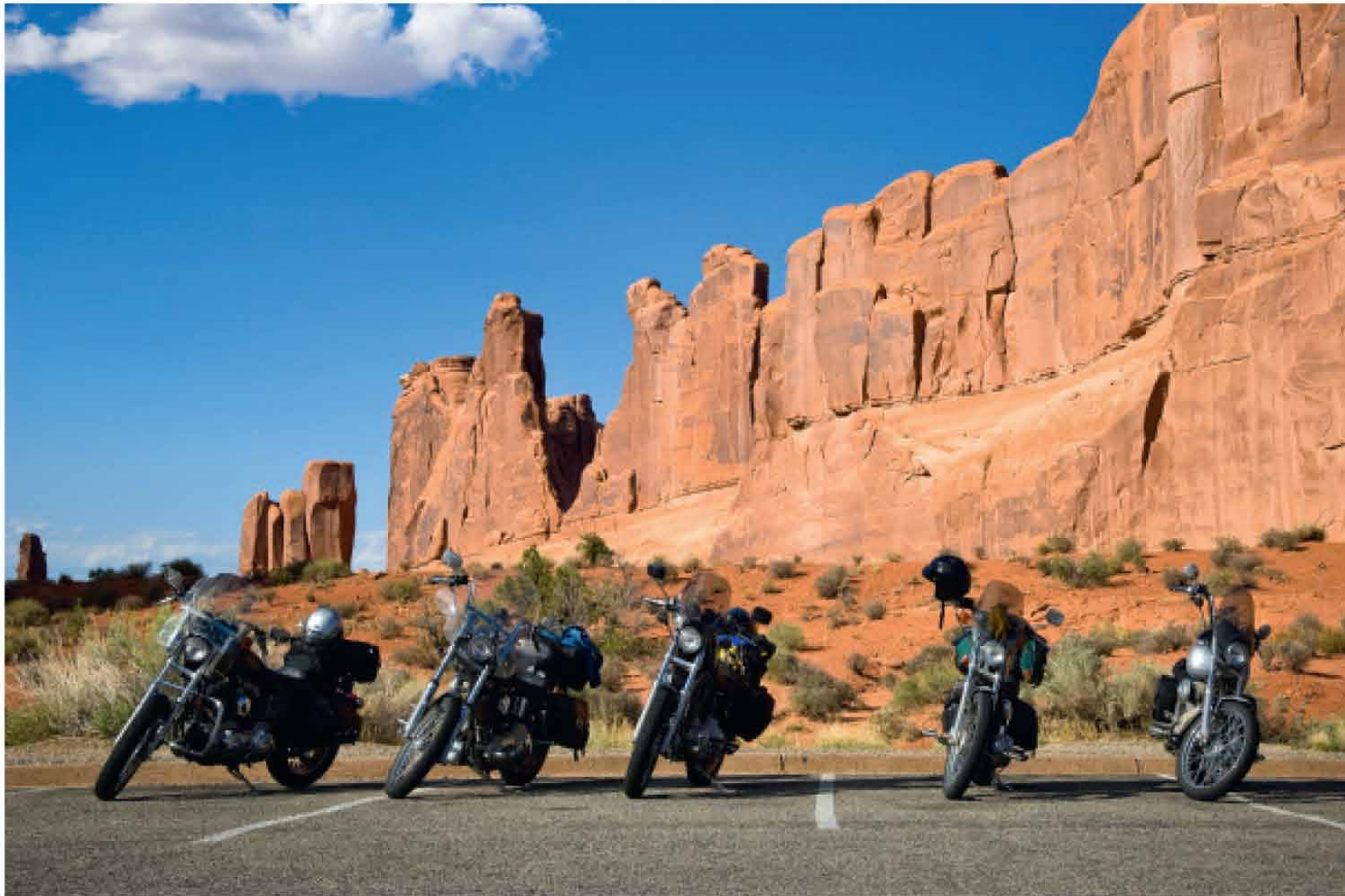
40-41 „HARLEY-DAVIDSON“ MOTOCIKLAI, YPAČ GERAI PRITAIKYTI TURIZMUI IR ILGOMS KELIONĖMS, NAUJUOSE VESTERNUOSE TAPO MECHANINIAIS ŽIRGŲ ATITIKMENIMIS.

Bendrovė „Harley-Davidson“ seniai suprato, kad perkantieji motociklus į savo transporto priemonę žiūri kitaip nei perkantieji automobilius, o „Harley“ pirkėjai savo ruožtu skiriasi nuo kitų motociklų vairuotojų. Trumpai tariant, nusipirkęs „Harley-Davidson“ motociklą netampi tiesiog transporto priemonės savininku. Kaip ir kiti motociklai, šie turi variklį, du ratus ir važiuoja gatvėmis, bet tuo panašumai ir baigiasi. Perkantieji „Harley“ nieško ko nors, kas juos paprasčiausiai nugabens iš taško A į tašką B, - jie nori išgyventi kažką tikro, o neretai ir dalytis šiais išgyvenimais su kitais, kurie taip pat propaguoja „Harley-Davidson“ gyvenimo būdą.