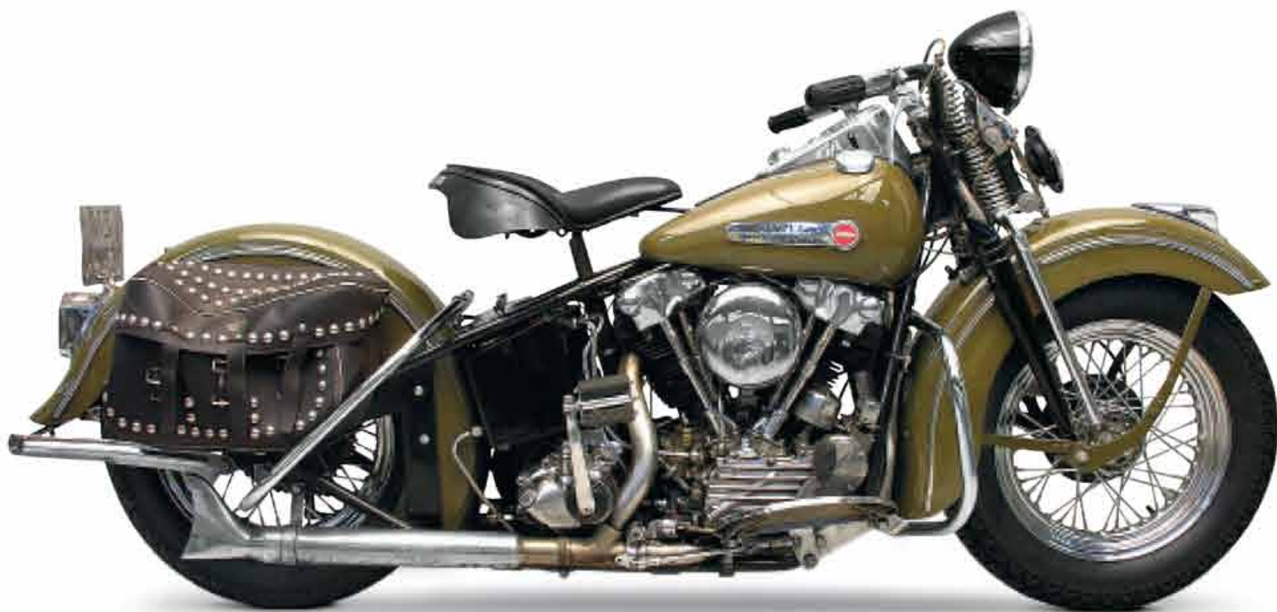
22. 1947-IEJI TAPO PASKUTINIAIS MODELIŲ SU „KNUCKLEHEAD“ VARIKLIAIS, ĮSKAITANT IR ŠĮ MODELĮ EL SU DAILIA CHROMO APDAILA, GAMYBOS METAIS.