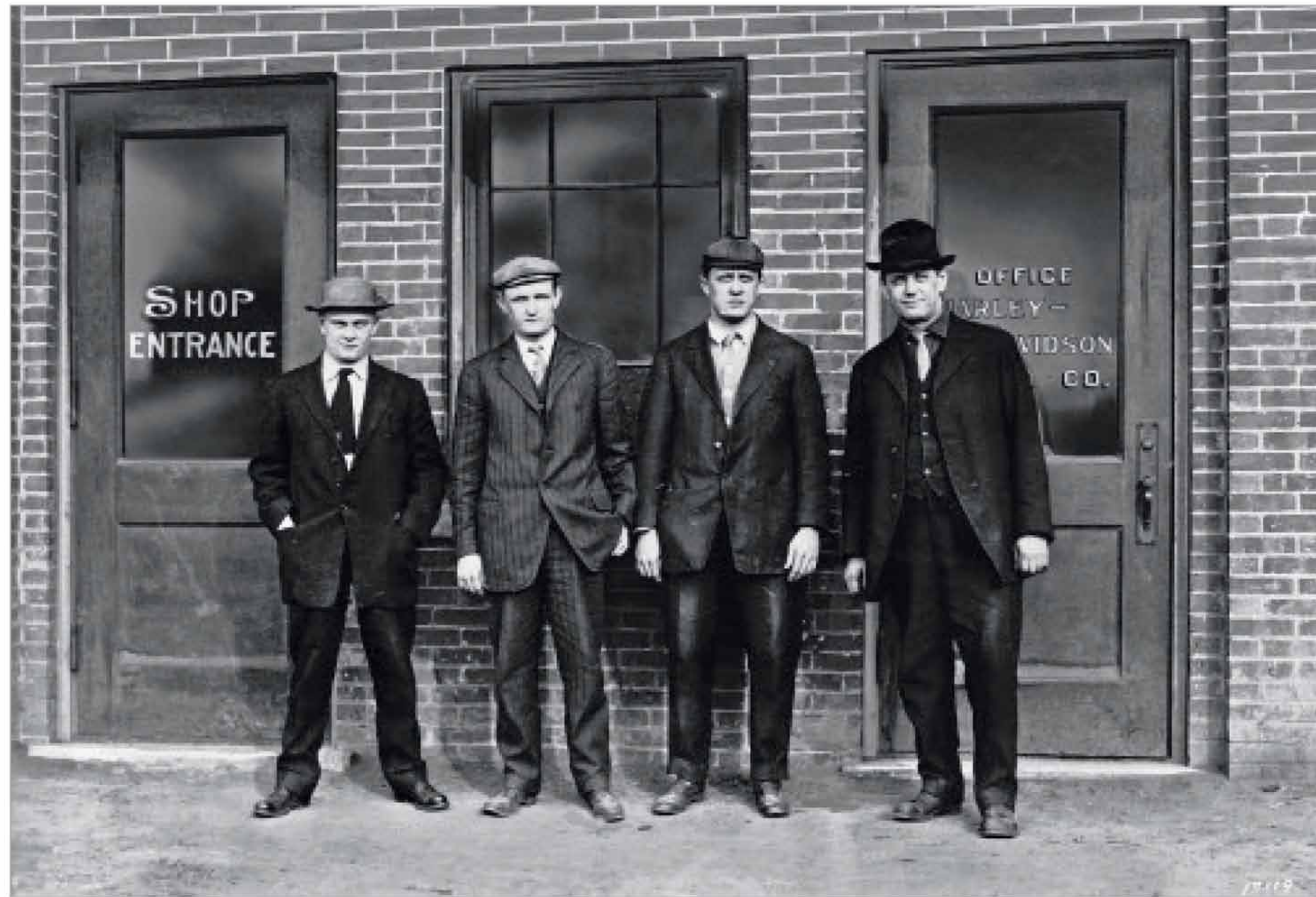
10–11 „HARLEY-DAVIDSON MOTOR COMPANY“ ĮKŪRĖJAI POZUOJA PRIE ĮMONĖS PATALPŲ 1910 METAIS. IŠ KAIRĖS: ARTHURAS DAVIDSONAS, WALTERIS C. DAVIDSONAS, WILLIAMAS S. HARLEY'IS IR WILLIAMAS A. DAVIDSONAS.

Oficialiai „Harley-Davidson“ istorija prasidėjo 1903 metais, tačiau „Harley-Davidson Motor Company“ pradžia sąlygojė įvykiai nutiko 1901-aisiais, užsimezgus Williama S. Harley'io ir Arthuro Davidsono draugystei. Pirmasis buvo kilęs iš anglų imigrantų šeimos ir nuo penkiolikos metų dirbo dviračių gamykloje. Mechanika žavėjęsis jaunuolis buvo gabus braižybai, tad dvidešimt vienerių įsidarbino braižytojo pameistrių metalurgijos gamykloje. Fabrike Williamas susibičiuliavo su darbininku iš mokyklos laikų – dabar mašinų operatoriumi – Arthuru Davidsonu, kurio šeima, emigravusi iš Škotijos, įsikūrė Jungtinėse Valstijose. Vaikinus vienijo aistra mechanikai. Juodu domino visos inovacijos, nuo automobilių iki dviračių, o ypač nauja transporto priemonė – motociklas.