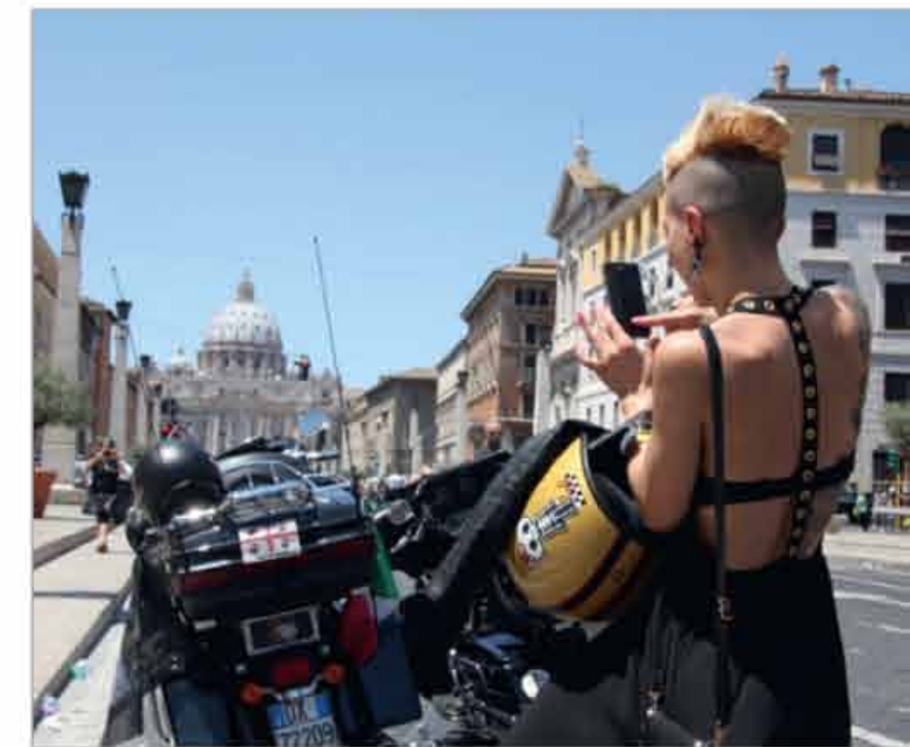
41 „HARLEY-DAVIDSON“ GERBĖJAMS DIDŽIULIAI ŠĄSKRYDŽIAI EUROPOJE, AMERIKOJE IR AZIJOJE TAIP PAT TAMPA DINGSTIMI PAŽINTI NAUJAS TURISTINES KRYPTIS.

Todėl „Harley-Davidson“ rinkodaros strategija yra paprasta, užtat labai veiksminga. Bendrovė skiria vos 15 proc. rinkodaros išlaidų reklamai tradicinėse žiniasklaidos priemonėse ir daugiau dėmesio - renginiams, kuriuose kiekvienas gali atrasti ir išbandyti, ką iš tiesų reiškia priklausyti „Harley-Davidson“ pasauliui ir kokia yra tokio gyvenimo būdo esmė. Tokia strategija investuotojams atneša grąžą ir net leidžia peržengti tradicinio motociklų pasaulio ribas, kai, pavyzdžiui, popiežius palaimina tūkstančius „Harley-Davidson“ vairuotojų kartu su jų motociklais.