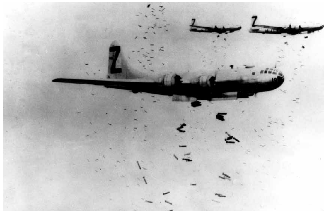
Amerikiečių sunkieji bombonešiai B-29 bombarduoja Japonijos miestus.

apie masinius antskrydžius Kurėje, Ivakunyje, Tokujamoje ir kituose gretimuose miestuose; jis buvo tikras, kad netrukus ateis Hirošimos eilė. Praėjusią naktį miegojo prastai, nes kelis kartus kaukė sirenos, įspėdamos apie oro pavojų. Jau kelinta savaitė miestas beveik kiekvieną naktį gaudavo tokių įspėjimų, nes tuo metu bombonešiai B-29 susitelkimo vietai naudojo Bivos ežerą, esantį į šiaurės rytus nuo Hirošimos. Kad ir kur amerikiečiai planavo smogti, supertvirtovės* praskridavo virš pakrantės netoli šio miesto. Dėl dažnų įspėjimų ir