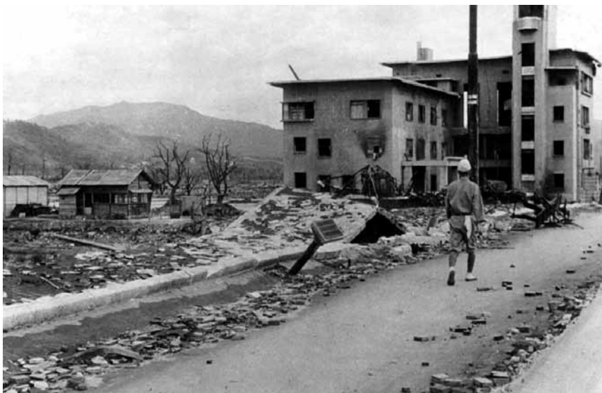
Sprogimo sugriauti miesto statiniai.