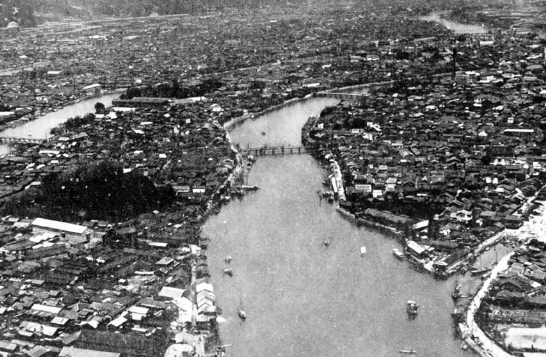
Hirošimos panorama prieš branduolinę ataką.

užsitęsusio pono B delsimo Hirošimos gyventojai pasidarė nervingi; sklido gandas, kad amerikiečiai ruošia miestui kažką ypatinga.