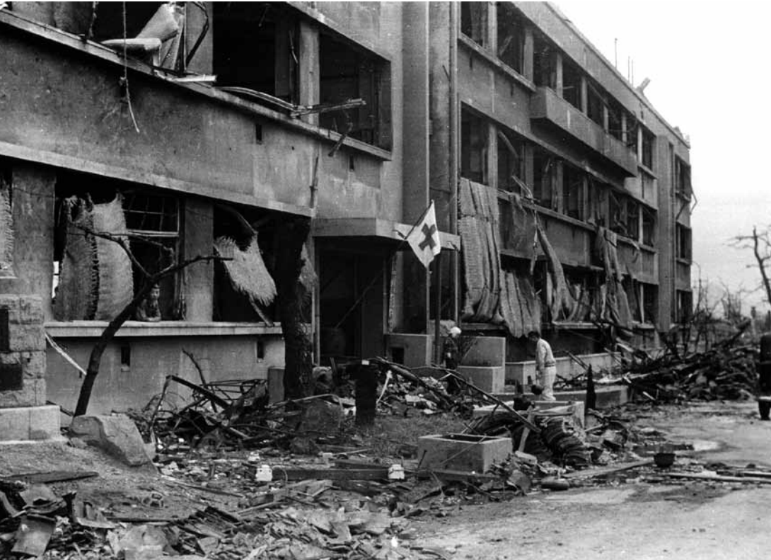
Laikina ligoninė, įrengta Hirošimos pradinės mokyklos pastato griuvėsiuose.