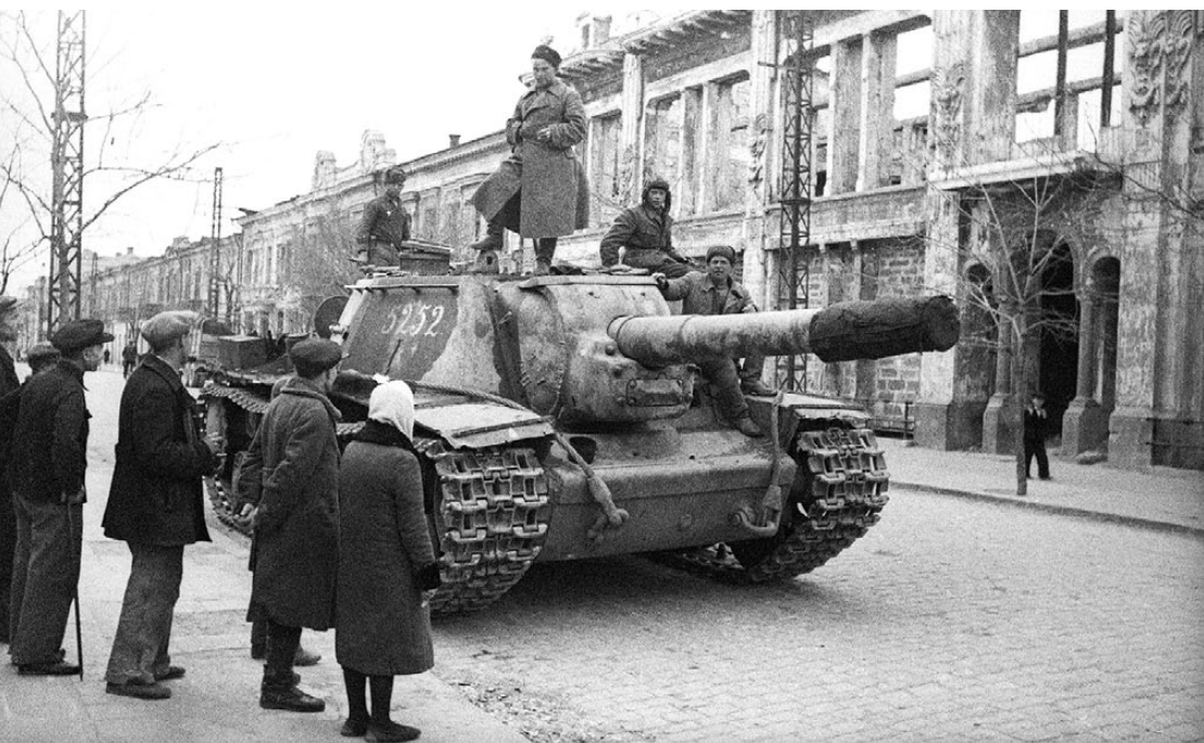
Sovietų savaeigis artilerijos pabūklas SU-152 Simferopolio gatvėje. 1944 m. balandis.

transportu. Bet kuriuo atveju šios lenktynės buvo beviltiškos, nes Jeriomenka puikiai išnaudojo savo techninį pranašumą.