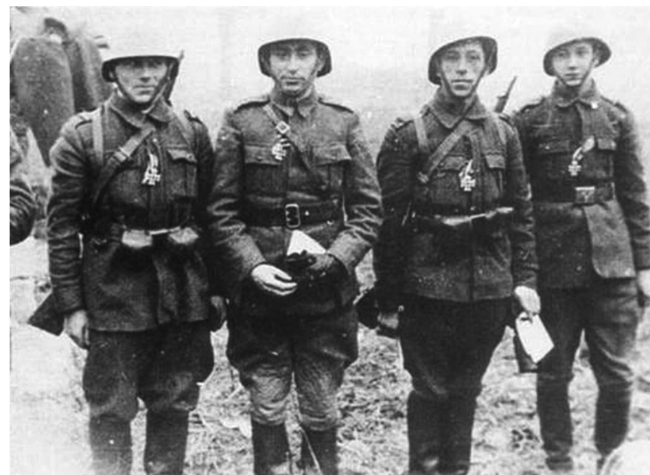
Geležiniais kryžiais apdovanoti vokiečių sąjungininkų rumunų kariai Kryme.