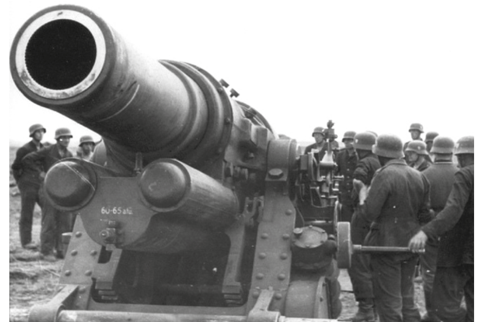
Vokiečių sunkioji artilerija Kryme.

Hitlerio nurodytų priežasčių, dėl kurių reikėjo ginti „Krymo tvirtovę“, nebuvo galima atmesti lengva ranka. Apie rugpjūčio vidurį jis