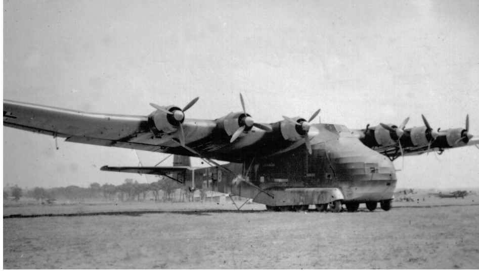
Vokiečių sunkusis transporto lėktuvas „Me-323 Gigant“.

vyriausiasis vadas grosadmirolas Dönitzas. Jis perspėjo Hitlerį, kad pasitraukimas iš Krymo iš esmės pablogins Vokietijos laivyno padėtį Juodojoje jūroje. O dėl 17-osios armijos aprūpinimo tikrai nekils sunkumų; karinis jūrų laivynas gali užtikrinti 50 000 tonų krovinių pristatymą per mėnesį. Jei vis dėlto teks kariuomenei atsitraukti, karinis jūrų laivynas irgi tuo pasirūpins. Turimais laivais galima išgabenti iki 20 000 žmonių su visa ginkluote per keturias dienas. Tai reiškia, kad visą 17-ąją armiją su 200 000 žmonių, su arkliais ir kovos technika pavyktų evakuoti per keturiasdešimt dienų, o jei oras smarkiai sugestų, išvežimas truktų apie aštuoniasdešimt dienų.