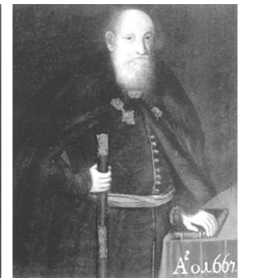
1667 m. Kristupo Zavišos portretas