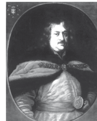
1670 m. Kristupo Paco portretas