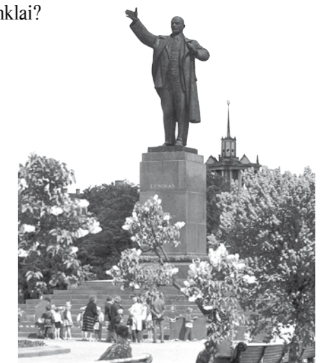
V. Lenino paminklas Vilniuje sovietmečiu.