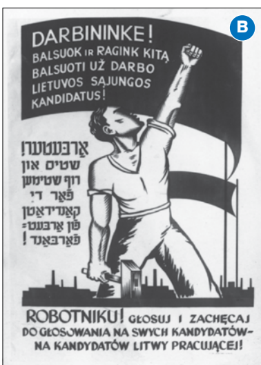
Komunistų agitacinis plakatas, skirtas rinkimams į Liaudies seimą.