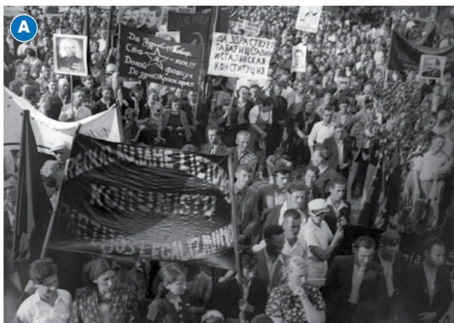
Komunistų mitingas, skirtas Liaudies vyriausybei paremti. Kaunas, P. Vileišio aikštė. 1940 m. birželis.