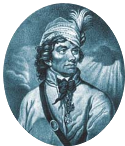
▲ Sukilimo vyriausiasis vadas, lenkų generolas Tadas Kosciuszka , pagarsėjęs JAV nepriklausomybės kare.