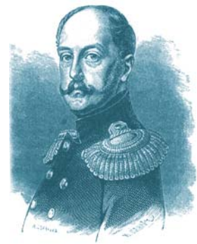
◀ Caras Nikolajus I (1796-1855) . Numalšines sukilimą Lenkijoje ir Lietuvoje. 1832 m. uždarė Vilniaus universitetą. 1840 m. sustabdė Lietuvos Statuto galiojimą, vietoj jo įsigaliojo Rusijos įstatymai.