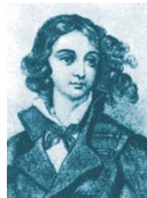
▲ Emilija Platerytė (1806-1831) . 1831 m. sukilimo Lietuvoje dalyvė. Dėl drąsos, įvyto, didvyriškumo pavadinta lietuvių Žana d'Ark.