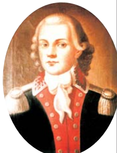
▲ Vyriausiasis 1794 m. sukilimo vadas Lietuvoje Jokūbas Jasinskis .