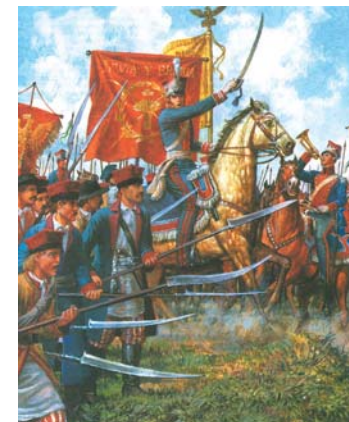
▲ 1830-1831 m. sukilimo Lietuvoje ir Lenkijoje kariuomenė. Sukilėliai nuo caro valdžios išvadavo beveik visą Lietuvą. Vyriausiasis Lietuvos sukilėlių vadas buvo Antanas Gelgaudas (1792-1831) .