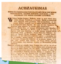
▶ Lietuvos tautinės aukščiausiosios tarybos 1794 m. atsisaukimas, raginantis ginti tėvynę ir stoti į sukilėlių gretas.