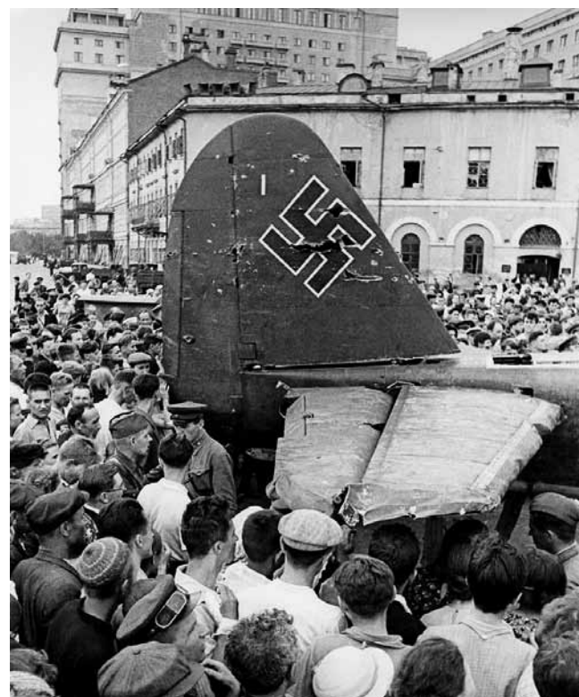
Maskviečiai apžiūri vokiečių lėktuvą „Junkers“ (Ju-88), 1941 m. liepos 25 d. numuštą sovietų 3-iojo naikintuvų korpuso pilotų netoli Istros. Po penkių dienų jis buvo demonstruojamas Sverdlovo (dabar Teatro) aikštėje Maskvoje. Ju-88 priklausė 122-osios žvalgybų grupės 2-ajai tolimųjų žvalgybų eskadrilei (2. (F)/122), atliko žvalgybinį skrydį į Kalugos sritį.