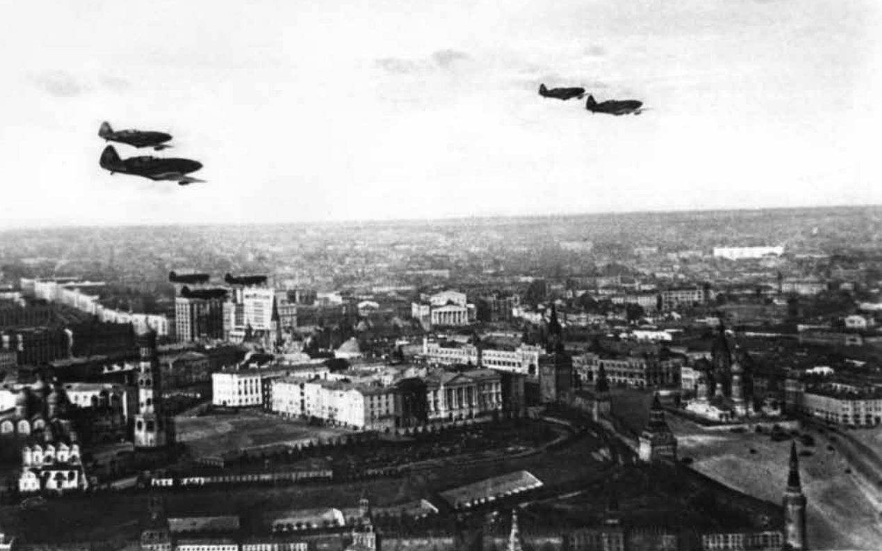
MiG-3 naikintuvai skrenda virš Kremliaus. Nuotraukoje taip pat matosi universalinė parduotuvė GUM ir Vasilijaus Palaimintojo cerkvė. Viduryje toluomoje – Didysis teatras. Mieste nėra daug daugiaaukščių pastatų. 1941 m. Maskva vis dar atrode kaip didelis kaimas, pilnas medinių pastatų.