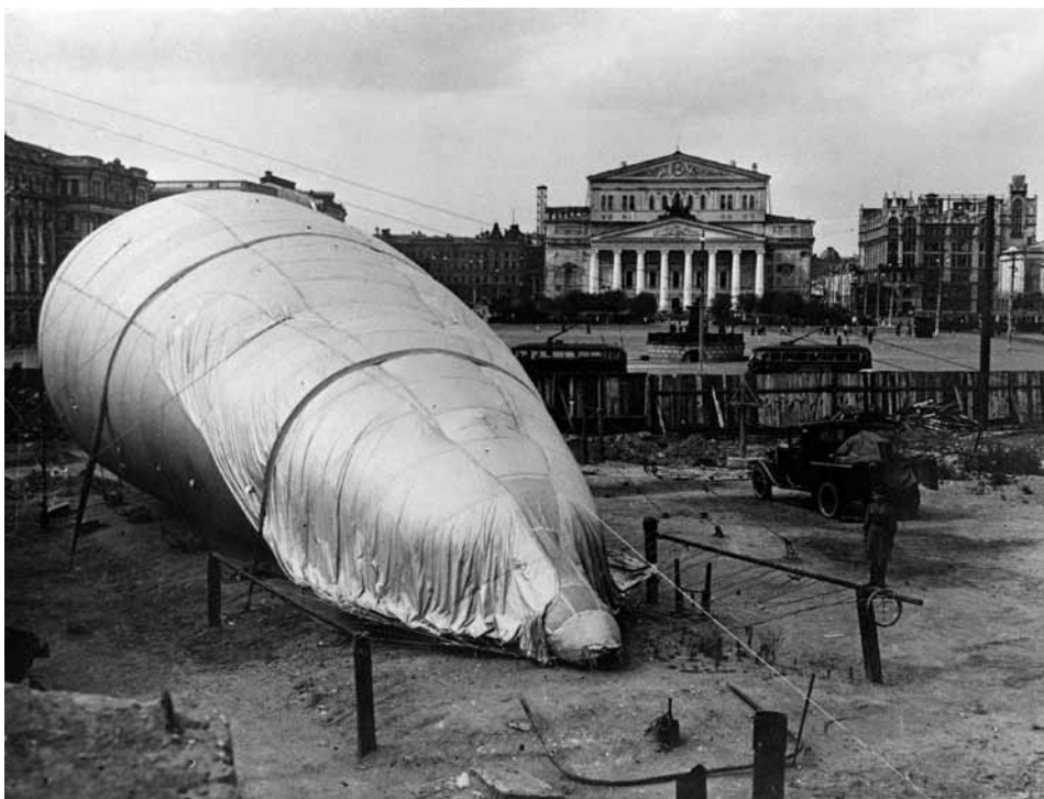
Kaip ir Londone, priešlėktuvinės užtvoros aerostatai buvo skirti tam, kad priverstų vokiečių bombonešius skristi aukštai ir trukdytų jiems tiksliai nusiaikyti. Kol jų neiškeldavo į orą, juos buvo galima pamatyti riogsančius beveik kiekvienoje atviroje miesto erdvėje.