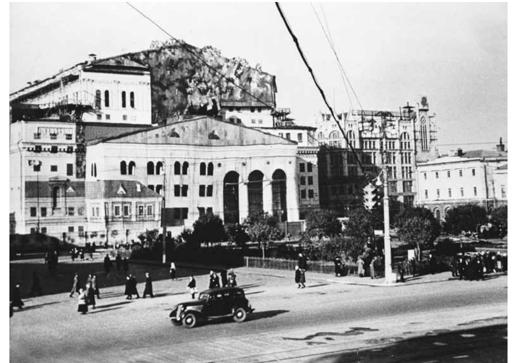
Gyvenamaisiais namais užmaskuotas Didžiojo teatro pastatas.