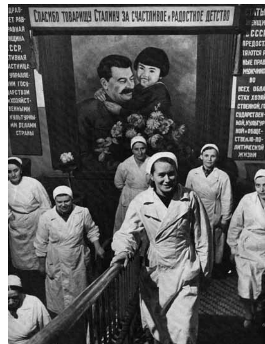
Maskvos ligoninės gydytojai prie plakato „Ačiū draugui Stalinui už laimingą ir džiaugsmingą vaikystę“.