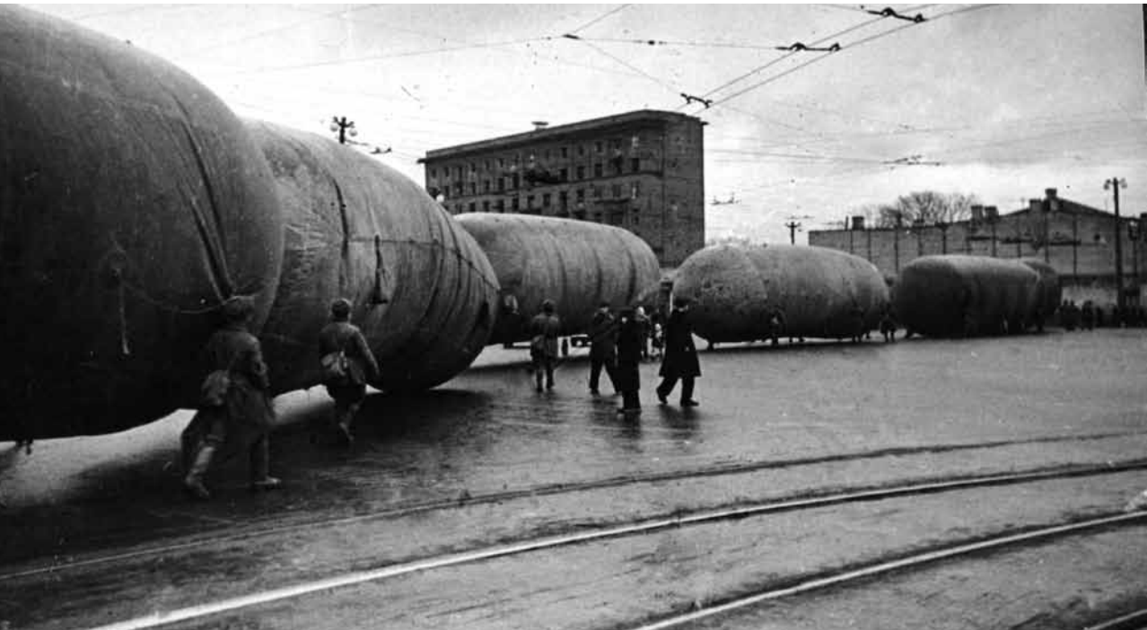
Dujų aerostatai gabenami Maskvos Kalužskajos gatve. 1941 m. spalio.