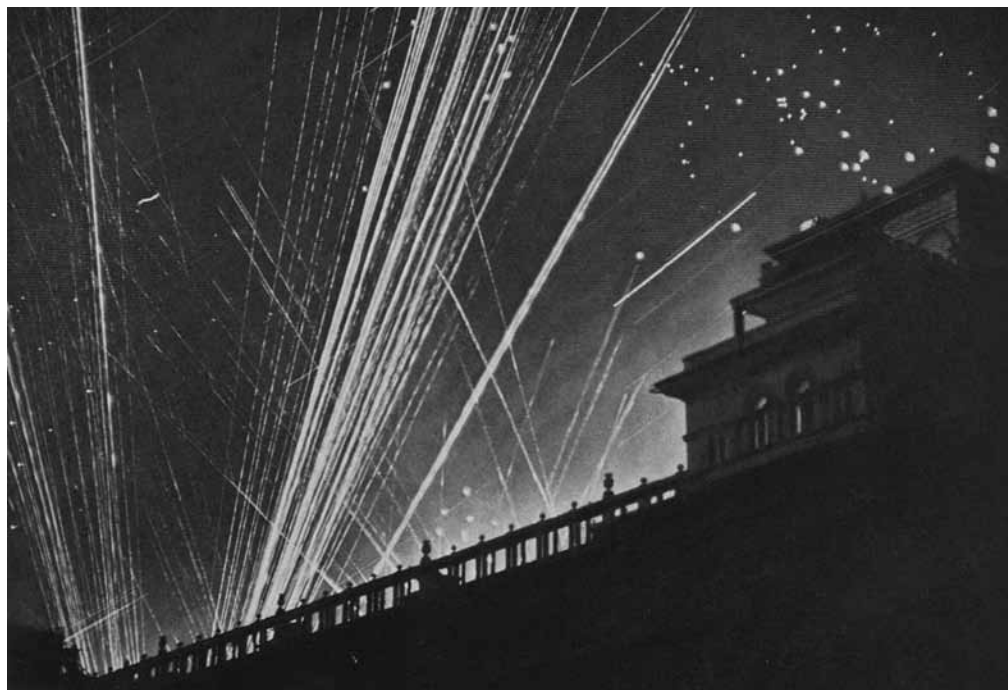
Vokietijos aviacijos antskrydis Maskvoje 1941 m. liepos 26 d. Priešlėktuvinė zenitinė artilerija apšaudo vokiečių lėktuvus, ant parašytų metančius šviečiančias raketas (šviesūs taškai danguje), kad apšviestų teritoriją ir orientuotų bombonešius.