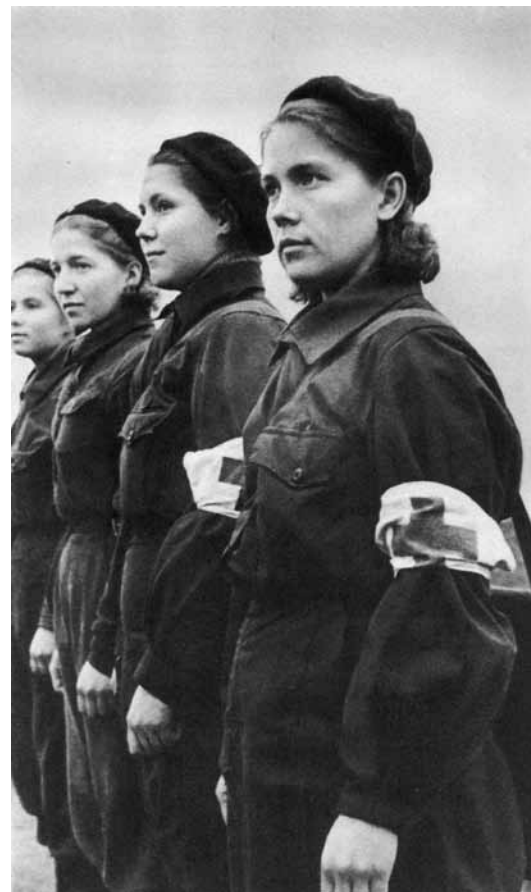
Slaugytojos iš komunistinio darbininkų bataliono, kuris priklausė Maskvos darbininkų diviziono 1-ajam pulkui. 1941 m. spalio.