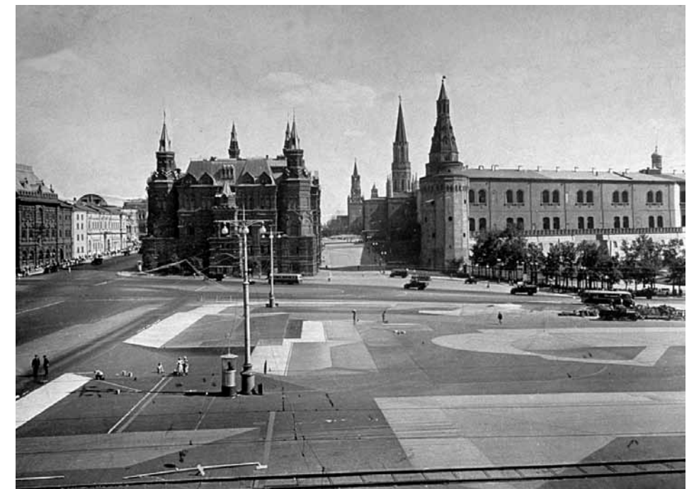
Moterys įrengia maskuotę Maniežnajos aikštėje Maskvoje, kad suklaidentų priešų bombonešių taikytojus.