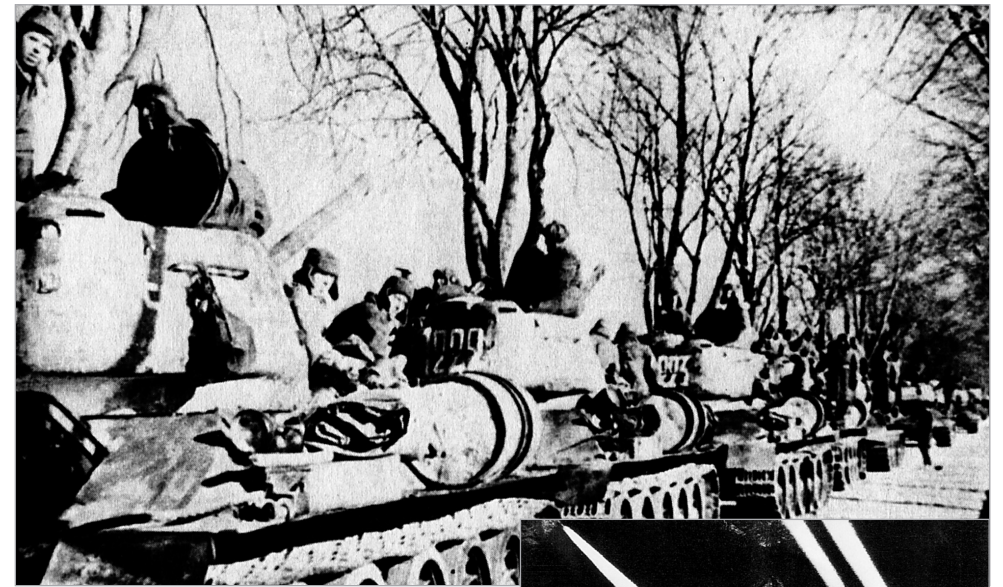
Raudonosios armijos tankų kolona Rytų Prūsijoje. 1944 m. gruodis

Baigiamajame karo etape Raudonoji armija turėjo daugkartinę tankų persvarą ir absoliučią kiekybinę persvarą ore. Pradedant 1944 m. rudeniu Rytų fronto padangėje pamatyti vokiečių naikintuvų pasisėkdavo retai, o vokišką bombonešį – praktiškai niekada. Vokiečių aviacijos likučiai naudodami paskutinius benzino lašus stengėsi užkirsti kelią nesibaigiantiems masiniams amerikiečių „skraidančiųjų tvirtovių“ antskrydžiams ir neleisti galutinai sunaikinti Vokietijos pramonę ir transporto tinklus. Neturi stebinti, kad esant tokiai ugnies persvarai Raudonosios armijos