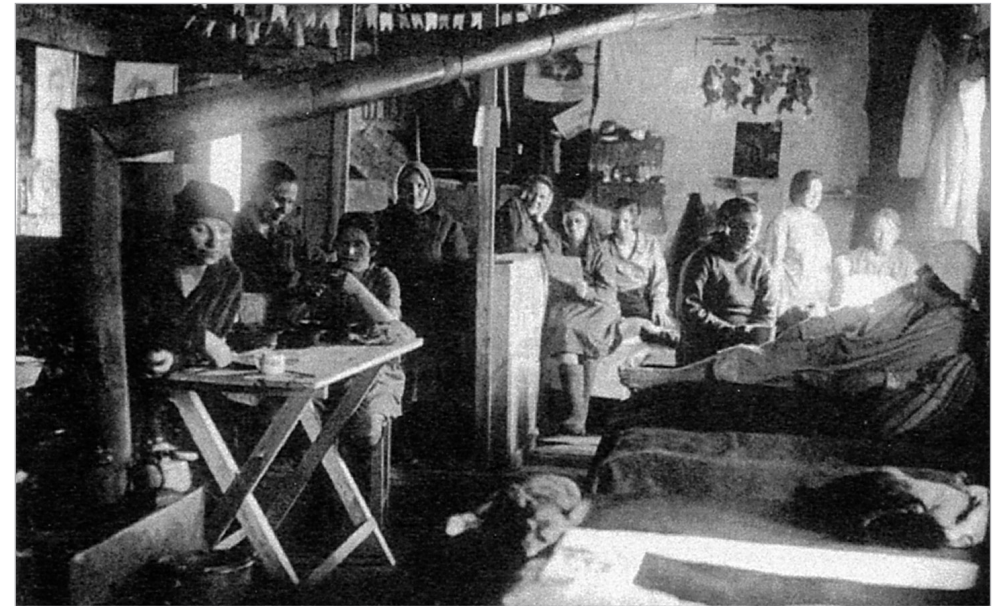
Moterys Gulago barake

1945 m. liepos 1 d., t. y. apytikriai praėjus 50 dienų po karo veiksmų Europoje pabaigos, Ginkluotosiose pajėgose ir kitų žinybų karo formuotėse pagal sąrašą buvo 11 mln. 793,8 tūkst. žmonių. Ligoninėse buvo 1 mln. 046 tūkst. kariškių. Aš nematau jokio pagrindo netikėti šių skaičių tikrumu ir patikimumu. Per 50 taikos dienų visų lygių vadai galėjo perskaiciuoti savo pavaldinius, parengti sąrašus, pateikti aukščiau esantiems štabams. Sužeistieji, kuriems buvo lemta mirti, jau mirė (karo medicinos statistika liudija, kad sužeistojo mirties ar gyvybės klausimas dažniausiai