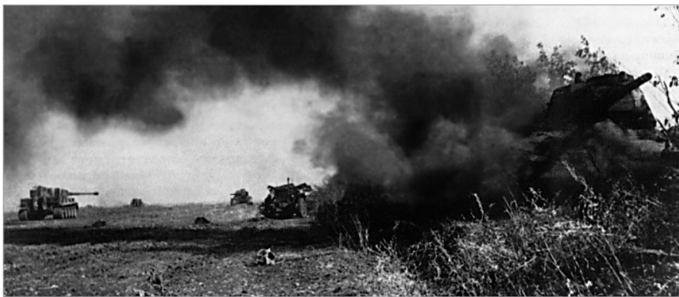
Kursko mūšio laukas. Priekiniame plane pamuštas tankas T-34, toliau dar vienas, kairėje vokiečių Pz-VI „Tigras“. 1943

Pasižiūrėkime 1943 m. trečiąją ketvirtį (liepa, rugpjūtis, rugsėjis). Šiuo periodu įvyko vienas didžiausių Antrojo pasaulinio karo mūšių – Kursko mūšis. Raudonosios armijos bendri nuostoliai sudarė 2 748 tūkst., tarp jų negrįžtami nuostoliai (žuvusieji ir dingusieji be žinios) – 694 tūkst. žmonių. Vermachto ir SS bendri nuostoliai – 709 tūkst., tarp jų negrįžtami – 231 tūkst. žmonių. Bendrų nuostolių santykis 3,8 su 1 . Negrįžtamų nuostolių santykis 3,0 su 1 .