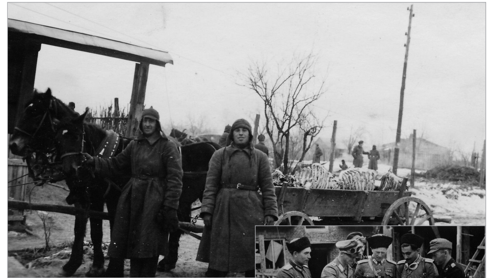
Hivai, Raudonosios armijos kariai, savanoriškai stoję į vokiečių pusę