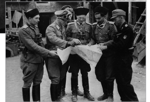
Rusų kazokai Vermachto tarnyboje

panikai ir chaosui, ištisi junginiai kartu su štabais ir visais dokumentais dingdavo be pėdsakų):