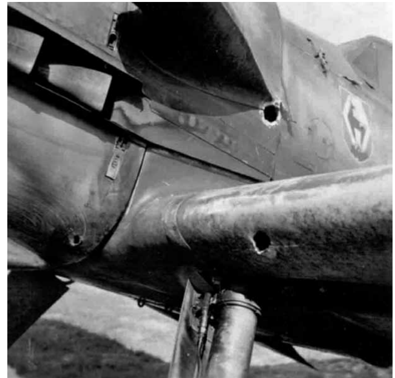
Kulkų išmuštos skylės „Messerschmitt 109“ korpuse.

– Gerasis Dieve! Man dar pasisekė. Truputį arčiau ir būčiau iškeliavęs į aną pasaulį. Iš kur ši tepalo dėmė? Variklis, atrodo, nepažeistas.