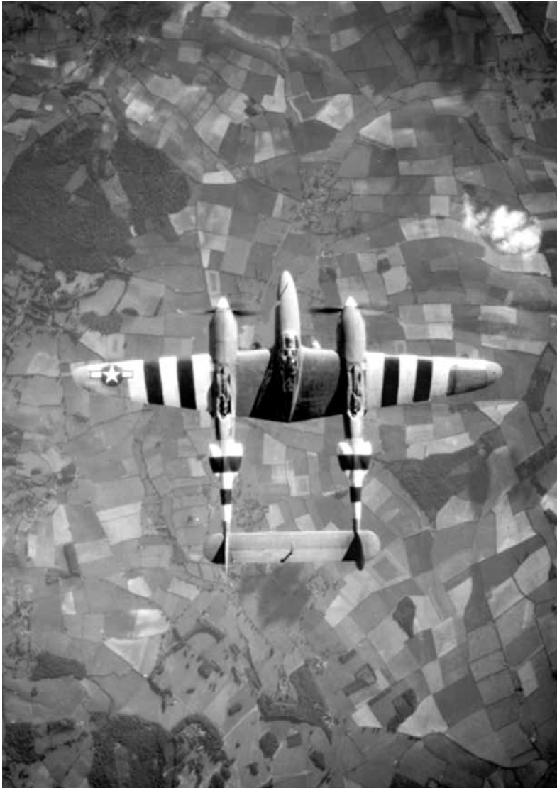
„Lockheed P-38 Lightning“ skrydis. Vaizdas iš viršaus.

Priešo naikintuvai ruošėsi pričiupti mane sukdami ratus, mėgindami pasiekti iš užnugario, supdami. Vienas atsidūrė kairiau už manęs, kitas dešiniau, trečias viršuje, o ketvirtas apačioje.