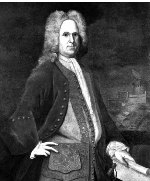
Alexanderio Spotswoodo (1676–1740), britų armijos pulkininko ir Virdžinijos gubernatoriaus, portretas. Charlesas Bridgesas, 1736 m.

34 tūkst. hektarų valstybinės žemės. Dauguma įstatymų leidėjų prieštaravo despotiškam reikalavimui vadovauti visų Anglikonų bažnyčios, oficialiosios kolonijos religijos, kunigų ir aukščiausių pareigūnų skyrimui. 1717 m. buvo atsižvelgta į įstatymų leidėjų peticiją karaliui; joje prašoma atmesti kai kuriuos Spotswoodo ekonominius reglamentus, o dabar apskritai siekta nušalinti jį nuo pareigų.