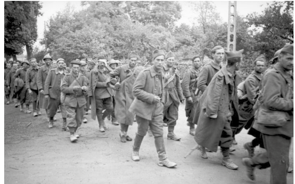
Prancūzų belaisvių kolona keliauja į vokiečių užnugarį. 1940 m.

Puolimas Araso link prasidėjo 1.00 val. (gegužės 20 d.). Rommelis lydėjo atakos smaigalyje važiuojantį tanką, kuris 6.00 val. pasiekė Boreną (pranc.