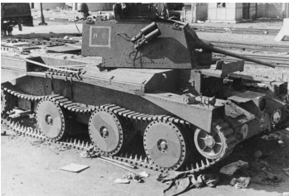
Mūšyje dėl Prancūzijos sunaikintas britų tankas „Cruiser Mk III“.

Nepriklausomai nuo visų realių rezultatų psichologinis ir moralinis poveikis, padarytas vokiečių aukščiausiai karinei vadovybei, buvo labai stiprus. Feldmaršalas von Rundstedtas, po karo aptardamas 1940 metų kampaniją, pasakė: „Kritinis puolimo momentas atėjo tada, kai mano pajėgos pasiekė Lamanšą. Priežastis – gegužės 21 d. britų kontrsmūgis pietų kryptimi nuo Araso. Kurį laiką atrodė, kad mūsų tankų divizijos bus atkirstos dar prieš pėstininkų divizijoms atvykstant jų paremti. Jokia prancūzų kontrataka nekėlė tokios rimtos grėsmės kaip tas kontrsmūgis.“ Ypač smarkiai paveikti buvo von Klugė ir von Kleistas. Klugė net buvo linkęs, kol padėtis nepaaiškės, stabdyti bet koki tolesnį puolimą į vakarus nuo Araso. Kleistas taip pat gerokai būgštavo. Štai kodėl, kai Guderianas gegužės 22 d. pasuko į šiaurę nuo Abvilio pulti Bulonės, Kalė ir Diunkerko link, puolimas buvo sulėtintas, nes jam trukdė von Kleisto įsakymai, apribojantys tolesnius veiksmus.