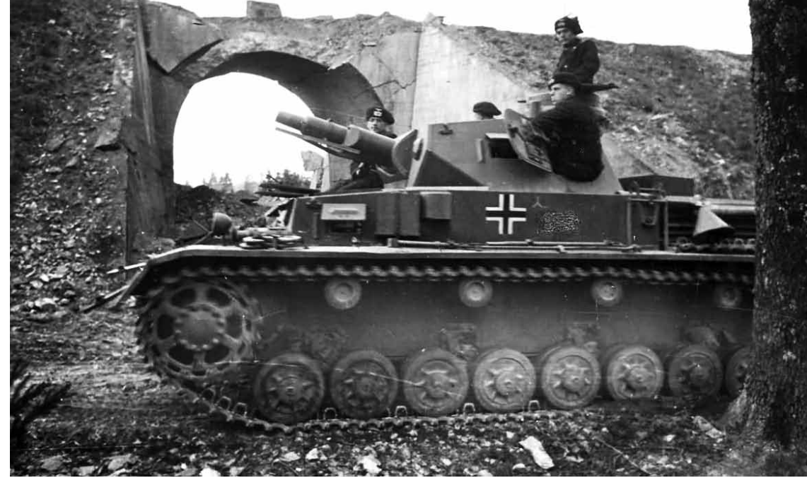
Vokiečių vidutinis tankas „Pz IV“ ir jo įgula. 1940 m.

Ankstų gegužės 27-osios rytą atvažiavau prie perkėlos ties Kuinši (pranc. Cuinchy) įvertinti padėtis. Vis dar labai aktyviai šaudė snajperiai,