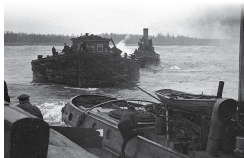
Krovininės baržos Ladogos ežere.

Rytuose buvo 60 km (neskaičiuojant kranto linijos išlinkimų) laisvo Ladogos ežero kranto. Rugpjūčio pabaigoje suomių kariuomenė Karelijos