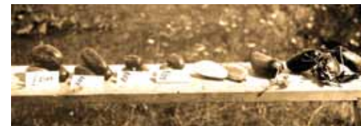
Ogórki karaimskie na wystawie rolniczej, Troki, ~1935 r.