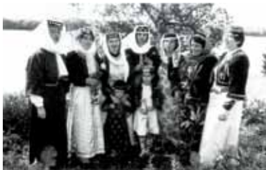
Kobiety karaimskie w strojach ludowych, 1991 r.

Witaj! Cześć! – Salam / Bazłych Dzień dobry! – Kiuń jachszy Do widzenia – Kal saw, Bol saw Na zdrowie! – Sawluchka / Kieszkie Kocham cię! – Mień sieni siuwiam