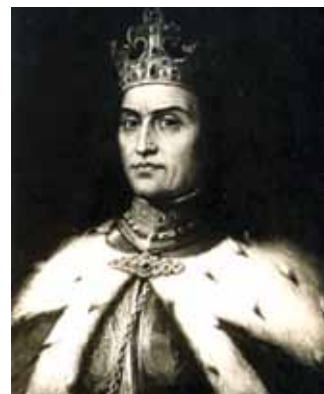
Pocztówka. Mal. J. Mackevičius, 1931 r.