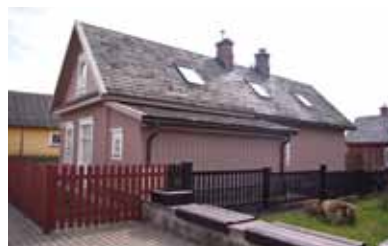
Drewniane domy karaimskie, z braku miejsca stawiane bokiem do ulicy, miały koniecznie trzy okna: jedno – dla Boga, drugie – dla Witolda, trzecie – dla gościa.

Karaimi (po semicku kara – czytać, studiować) są drobnym ludem tureckim, należącym do plemienia Kipczaków z Azji Środkowej, nigdy w historii nie posiadającym własnej państwowości. W końcu XX w. na świecie (na Ukrainie, w Polsce, Rosji) żyło około 3700 Karaimów, na Litwie – blisko 300. Wyznanie – odłam judaizmu, uznający Stary Testament. W obrzędach używają języka hebrajskiego