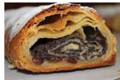
Tatarzy litewscy robią przekładaniec z ciasta drożdżowego już 600 lat. Był popularnym daniem na dworze wielkiego księcia Witolda. Częstowano nim gości zagranicznych. Znany w wielu krajach na świecie, jednak robią go tylko Tatarzy litewscy.