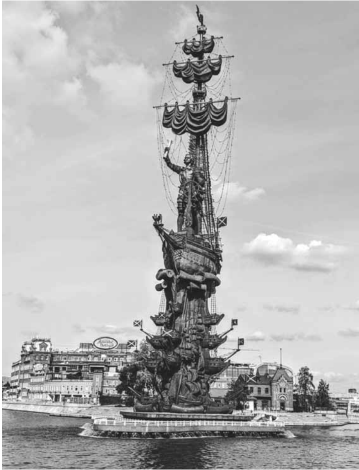
Zurabo Ceretelio „Petras Didysis“, 1997 m.

Iškilęs 98 metrus (322 pėdas) virš Maskvos upės, tarp hipsterių barų buvusiam „Raudonojo spalio“ šokolado fabrike, ištaigingų Prečistenskajos krantinės namų ir Muzeono menų parko Skulptūrų sodo stovi caras Petras Didysis (valdęs 1682–1725 m.), įamžintas tūkstančiu tonų plieno, bronzos ir vario. Tai stebėtinai