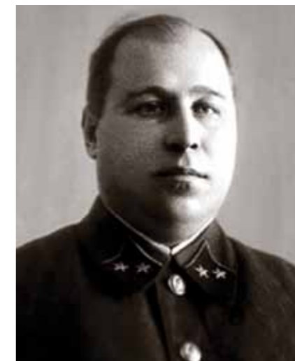
Kremliaus komendantas NKVD generolas Nikolajus Spiridonovas. XX a. ketvirtojo dešimtmečio pabaiga.