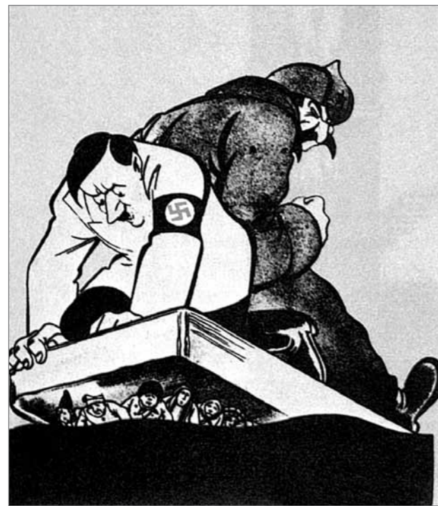
„Neutralijų spaudimas“. Molotovo–Ribbentropo pakta pašiepianti 1939 m. prancūzų karikatūra.

Stalinas aiškina, jog Sovietų Sąjunga anaip-tol tokio padalijimo nenorinti, jog to ruožo Lietuvos pasienyje reikalavę vokiečiai, ir jei jie nuo savo reikalavimo atsisakys, tai ir tas ruožas pasiliks prie Lietuvos. Galime tuojau pat, – kalbėjo toliau Stalinas, – pasikviesti Vokietijos ambasadorių von Schulenburgą ir su juo tą klausimą aptarti.