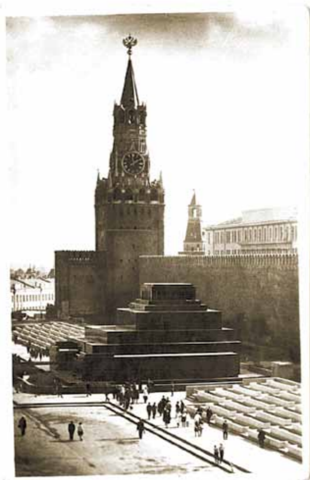
Raudonoji aikštė ir V. Lenino mauzoliejus. Ant laikrodžio bokšto dar matomas carinės Rusijos herbo simbolis – dvigalvis erelis, kuris netrukus bus pakeistas žvaigžde. 1932 m.

Atvažiavę kiek prieš 22 valandą, stojome į eilę automobilių, laukiančių, kad praleistų pro var-tus. Automobilius rikiavo uniformuoti saugumo pareigūnai.