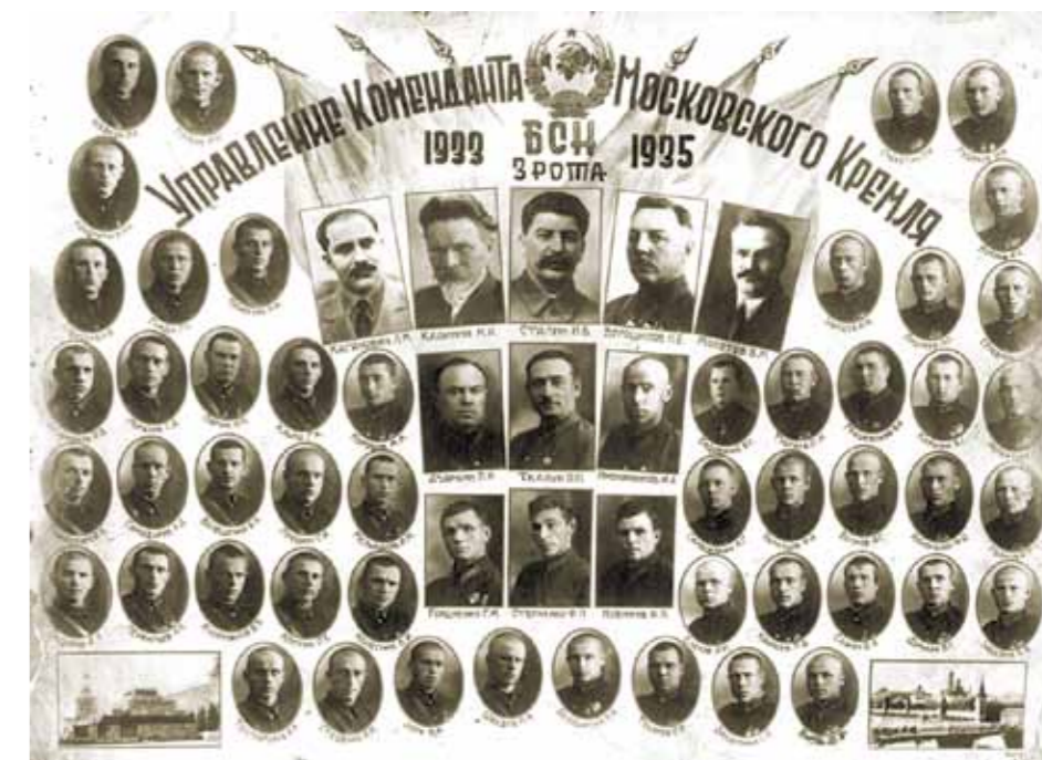
Kremliaus komandanto valdybos 3-iosios kuopos enkavėdistai 1932–1935 m. To meto nuotraukų montažas. Centre – J. Stalinas ir ištikimi jo bendražygiai: L. Kaganovičius, M. Kalininas, V. Molotovas bei K. Vorošilovas.