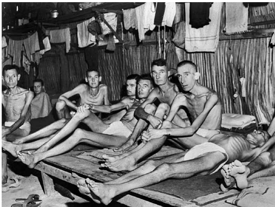
Tokie mes buvome. Šie skeletus primenantys karo belaisviai, išvaduoti Čangio stovykloje, buvo verčiami dirbti po 18 valandų prie Mirties geležinkelio, o jų gyvybę palaikė vos sauja ryžių per dieną. (Australijos karo memorialas, Nr. 019199)