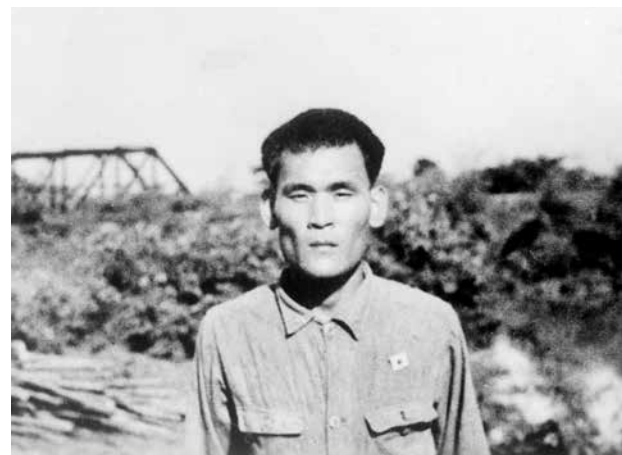
„Pasiutęs mišrūnas“. Po susidūrimo su šiuo sadištu sargybiniu korėjiečiu, kurį 1946 m. britai pakorė už karo nusikaltimus, iki šiol turiu randų.