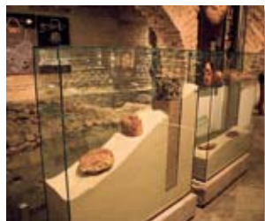
Das Bernsteinmuseum 9 Das kleine, frei zugängliche Museum beherbergt eine beeindruckende Bernsteinsammlung.