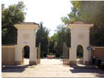
Der Sereikiškių Park 8 Einst floss die Vilnia durch den Park und teilte ihn in drei Gärten: den Bernhardiner-, den botanischen und den Burggarten.