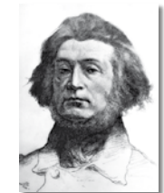
Das Haus von A. Mickevičius 7