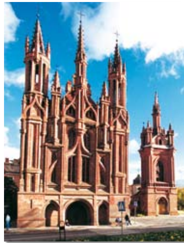
Die Kirche der hl. Anna 2 ist eine der künstlerischsten, „flamenden“ Kirchen der Backsteingotik.

Rund um das Franziskanerkloster gab es einen Garten, Teiche und einen neu angelegten Wasserlauf. Während der sowjetischen Okkupation waren in Kirche und Kloster Kasernen und Lagerhallen eingerichtet. Die Kirche war geplündert und schwer zerstört. Obwohl ihr Interieur noch rekonstruiert wird, ist sie eine der beliebtesten Kirchen der Jugend von Vilnius.