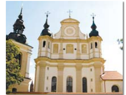
Die Kirche des hl. Erzengels Michael 6 ist eine Renaissancekirche und Mausoleum der Großfürstenfamilie der Sapiega