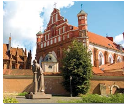
Die Kirche des hl. Franz von Assisi und des hl. Bernhard 3 ist eine gotische Kirche mit Renaissance- und Barockelementen.