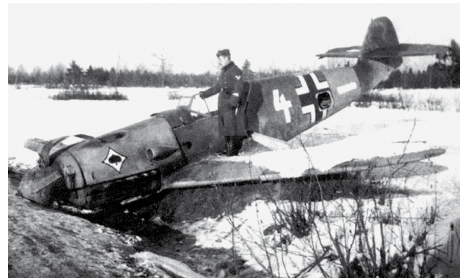
Sudužęs Bf-109 Rytų fronte.

Kai 1955 metais grįžo į Vokietiją, teko išgerti dar vieną kartybės taure. Sūnus Peteris Erichas mirė 1947 metais ir Šviesiaplaukis Riteris niekada berniuko nematė. Mylimas tėvas taip pat mirė. Berniukiškos viltys paveldėti tėvo gydytojo profesiją dėl amžiaus ir ilgo atskyrimo nuo medicinos pasaulio virto dulkėmis. Juk beveik trečdalį gyvenimo kalėjo rusų lageriuose. Jo šlovės dienų seni oro tigras įtikinėjo stoti į naująsias Vokietijos oro pajėgas. Jie pradėjo tikrą kampaniją siekdami grąžinti Hartmaną į