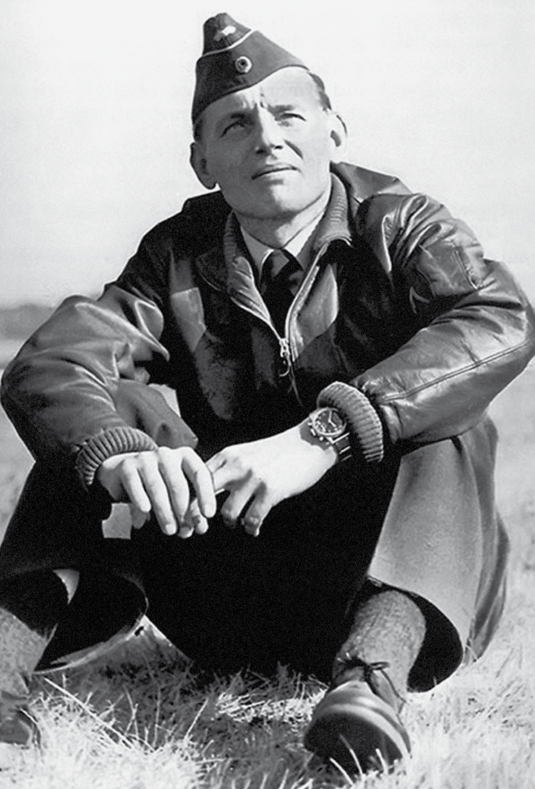
Liufvafės asas Erichas Hartmanas ( Erich Hartmann ).