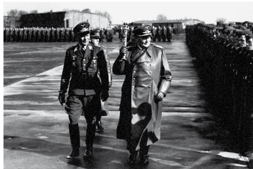
Vokietijos reichsmaršalas Liuftvafės vyriausiasis vadas H. Geringas.

Dešimt metų trukusi kova su rusų slaptąja policija paaštrino Ericho įgimtą atvirumą. Jis nekentė išsisukinėjimų ir jei susidurdavo su klaidomis, apie tai kalbėjo garsiai ir atvirai. Net reichsmaršalas Geringas tuo metu, kai nacistai buvo Vokietijos valdžioje, negalėjo perkalbėti jaunojo aso Ericho Hartmano, kuris protestavo, nusprendęs, jog Geringas elgiasi neteisinaigai. 1944 metų sausį Erichas aplankė netoli Juteborgo gyvenančią motiną.