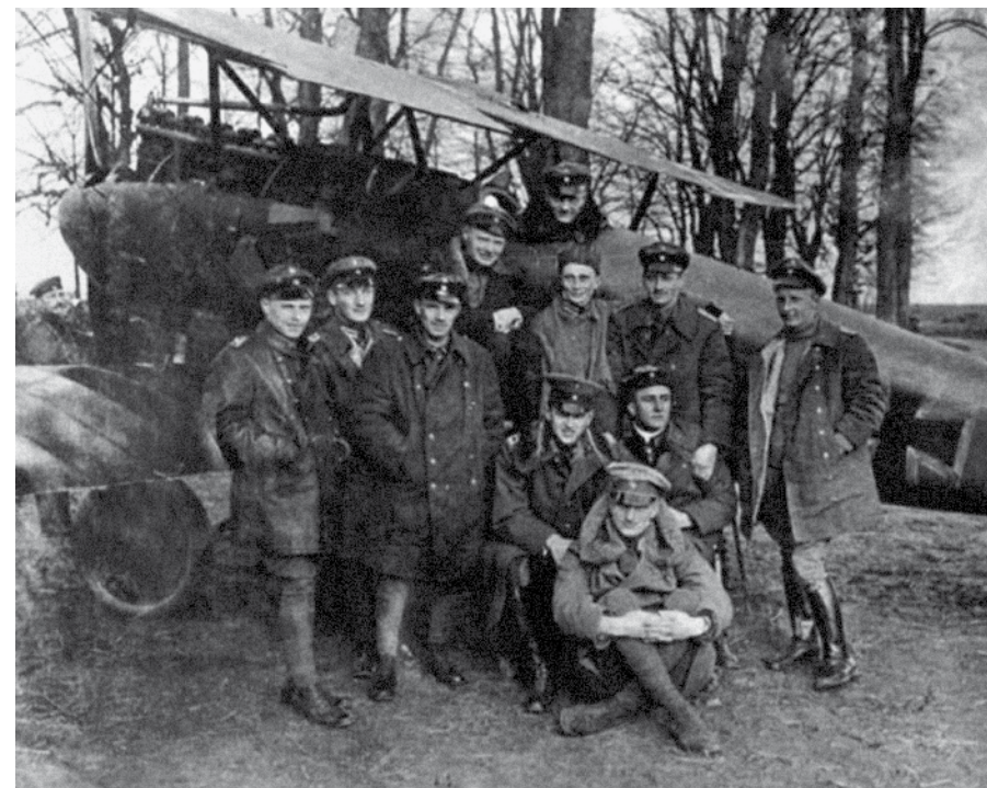
Geriausias I pasaulinio karo asas baronas M. fon Richthofenas ( M. von Richthofen ) lėktuvo kabinoje.

Per apdovanojimo ceremoniją visi keturi pilotai įstengė pastovėti ant kojų, tačiau ir iki šios dienos, kai tik ketvertas susitinka, Ericho Hartmano mėginimas paglemžti fiurerio kepurę tebėra juokų objektas. Kadangi Hartmano veikla nebuvo itin smagi, o vėliau asui teko išgyventi tiesiog žiaurių išbandymų, Bubio humoro jausmas plačiai visuomenei liko nežinomas. Tačiau humoras – neatsiejamas jo charakterio bruožas ir jis niekada nebūtų tokiu tapęs, koks yra, jei ne tas humoras. Karo istorijos analuose ne tiek daug Hartmanui prilygstančių herojų. O aviacijos istorijoje – dar mažiau. 352 patvirtintos oro pergalės lieka nepralenkiamas laimėjimas. Jo artimiausias varžovas Gerdas Barkhornas turėjo 51 pergale mažiau. Šviesiaplaukis Vokietijos Riteris numušė daugiau nei keturiskart didesnę skaičių priešų lėktuvų negu nemirtingasis baronas Manfredas fon Richthofenas, geriausias Pirmojo pasaulinio karo asas. Net iš didžiulį krūvį patyrusių