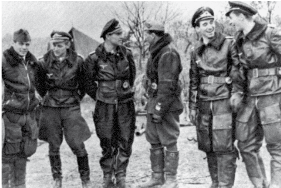
Vokiečių eskadrilės JG-52 asai E. Hartmanas ir G. Barkhornas vokiečių ir vengrų lakūnų draugėje. Rusija. 1944 metai.

panašu į nusikaltimą. Turime palaukti, kol padangė pragiedrės ir vėl pasirodys bombonešiai. O tada reikia pasiūsti visus ir vienu metu atakuoti priešą turint tam tikrų sėkmės galimybių. Tiesiog gėda taip švaistyti jaunų karių gyvybes, kaip buvo padaryta šiandien. Nuoširdžiai jūsų kapitonas E. Hartmanas, 52-oji naikintuvų eskadra“.