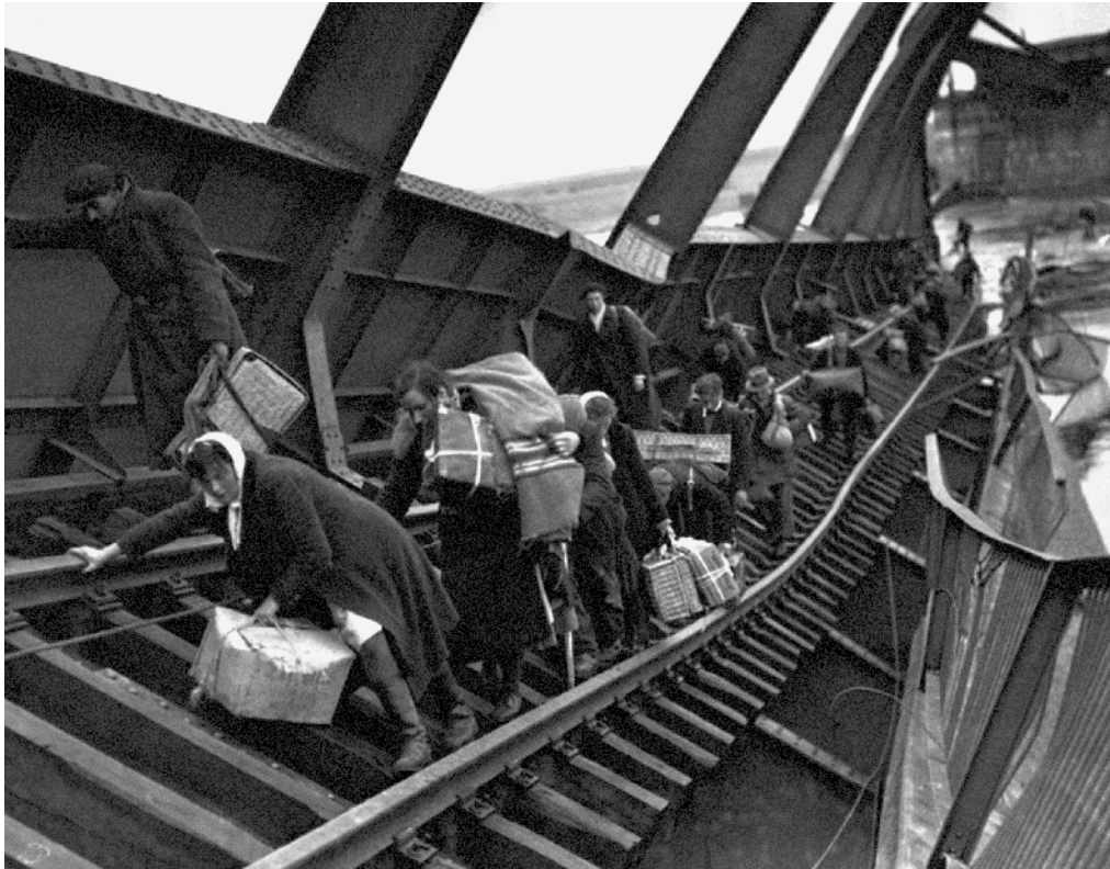
Vokiečių pabėgėliai eina sugriautu tiltu per Elbę. 1945 m. gegužė.