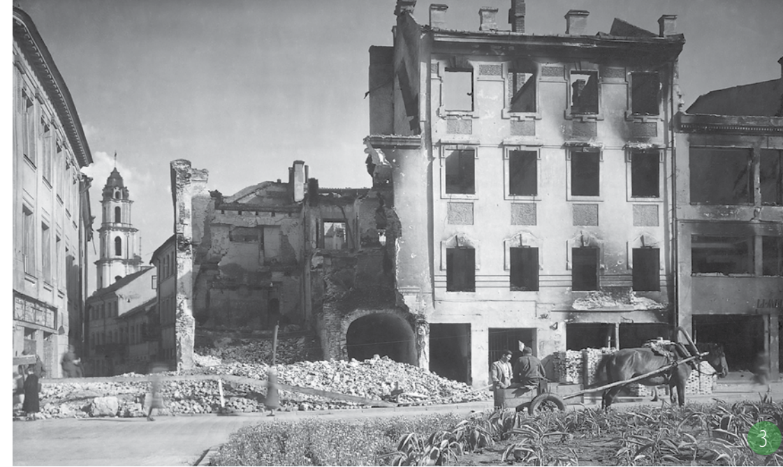
③ Savičiaus ir Didžioios gatvių sankryža. Sovietmečiu pastatai nugriauti. 1944 m. J. Buthak. VMS KPS albumas, Nr. 101.