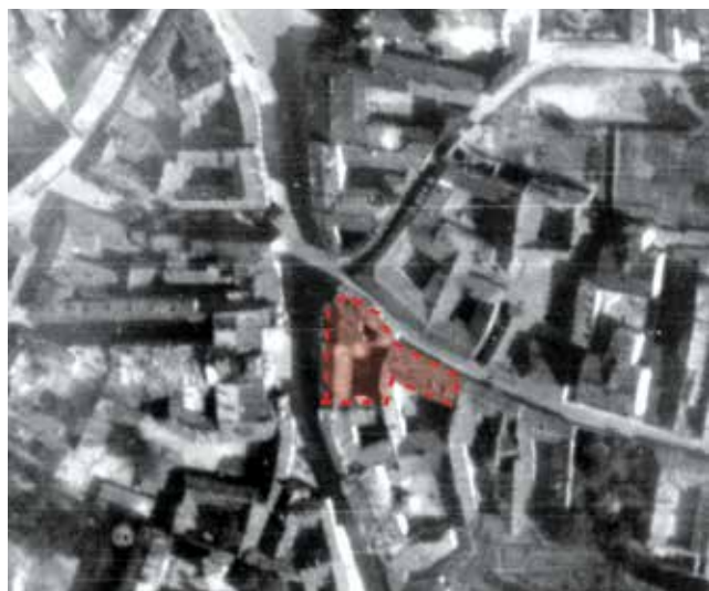
↑ Aušros Vartų ir Subačiaus gatvių sankryža. 1944 m. liepos 11 d. vokiečių žvalgybinė aeronuotrauka. NARA, NS4E-121, Nr. 064.