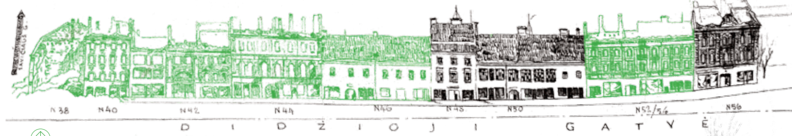
↑ Didžioios gatvės rytinės pusės išklotinė. J. Kamarausko piešinys. 1944–1945 m. Žalia spalva pažymėti sovietmečiu nugriauti patatai. KPC archyvas, f. 36, ap. 1.

jie privalėjo atsitraukti iki linijos Šv. Kazimiero bažnyčia–Šv. Kotrynos bažnyčia. 4 Senamiestį sudegino liepos 11 d. į Vilnių įžengė raudonarmiečių liepsnosvaidininkai, o išvakarėse sovietų generolai jau buvo paskelbę apie miesto užėmimą. 5 Sovietmečiu Didžioios g. namai Nr. 38, 40, 42, 44 nugriauti ir jų vietoje XX a. 6-ajame dešimtmetyje pastatytas didžiulis stalininės architektūros pastatas. ⑥ Tokia pati lemtis ištiko ir gretimą Didžioios g. Nr. 46 (dabar toje vietoje Nr. 22) pastatą, nors jo istorija kiek kitokia.