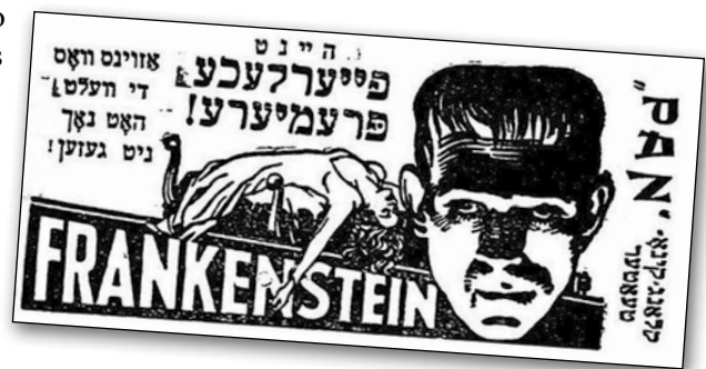
↑ Kino teatro „Pan“ reklama. Apie 1932 m.

į šonines fojė. Hitlerininkai tikino, kad šis namas būsiąs apsaugotas nuo bombų ir gaisrų. Ir kada žmonės nusiramino,