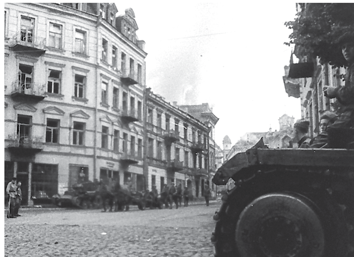
↑ Prie nepažeisto Aušros Vartų pastato Nr. 2 raudonarmiečiai su lendliziniu britų tanku „Valentine“. Apie 1944 liepos 11 d. Kadras iš sovietinės kino kronikos.