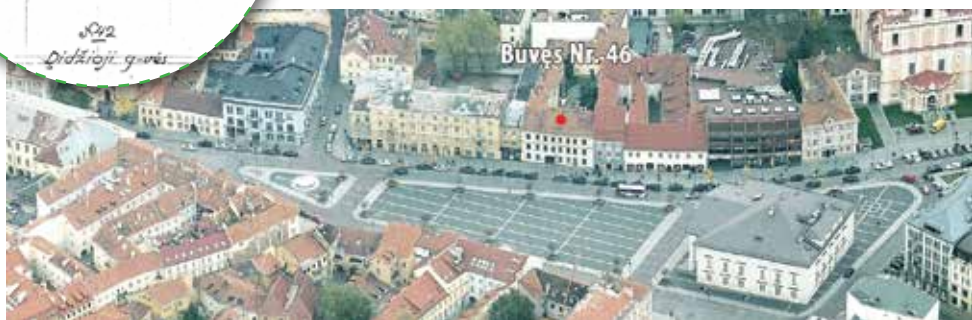
↑ Didžioios g. rytinės pusės vaizdas iš paukščio skrydžio. 2008 m.