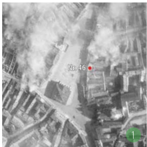
① Vokiečių aeronuotrauka. 1944 m. liepos 11 d. NARA, NS4E25-121, Nr. 063.