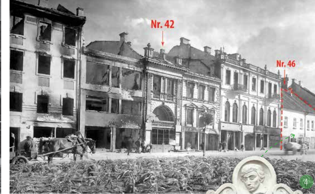
④ Didžioios gatvės rytinė pusė. Namas Nr. 46, kuriame gyveno A. Mickevičius, nepažeistas. Sovietmečiu pastatai nugriauti. 1944 m.