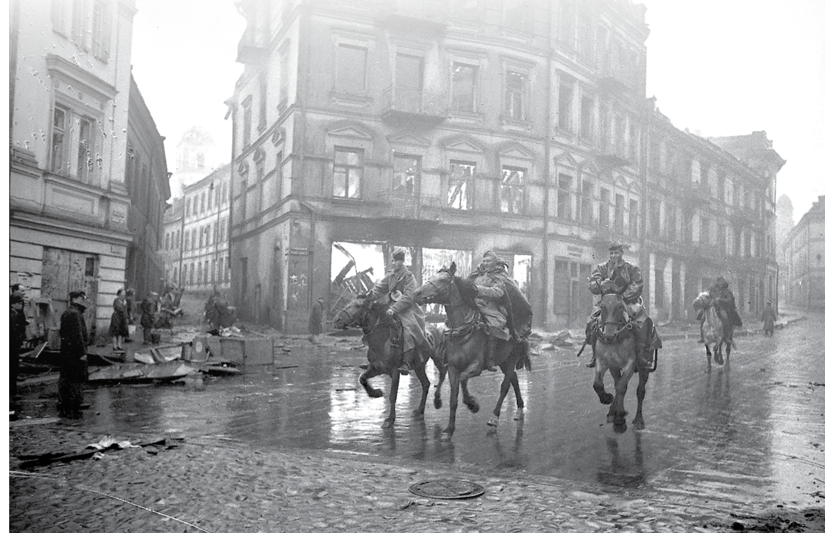
↑ Šlapiu gatvės grindiniu joja Raudonosios armijos kavaleristai. Subačiaus ir Aušros Vartų gatvių sankryžoje suversti išplėsti rakančiai. 1944 m. liepos 13 d. S. M. Gurarij nuotr. РГАКФД, Nr. 0-251407.

rūmus prie Lukiškių aikštės 2 . 1944 m. liepos 11 d. vokiečių žvalgybinėse aeronuotrukose matyti, kad Aušros Vartų g. Nr. 2 pastatas išliko karo nepalietas. Bet 1944 m. liepos 20 d. vokiečių žvalgybinėje aeronuotrukoje namai Nr. 2, Nr. 4 jau be stogų, Nr. 6 – be dalies stogo. Čia ir slypi Aušros Vartų gatvės namų dingimo paslaptis. Kas gi jiems nutiko, juk liepos 11 d., kai šį rajoną užėmė sovietai, namai buvo nepažeisti? Šis rajonas sulaukė ypatingo karo kronininkų dėmesio. Lietuvos centrinio valstybės archyvo (LCVA) kino dokumentų skyriuje saugomose