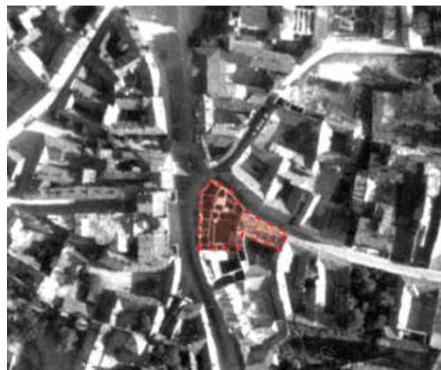
↑ Aušros Vartų ir Subačiaus gatvių sankryža. 1944 m. liepos 20 d. vokiečių žvalgybinė aeronuotrauka.