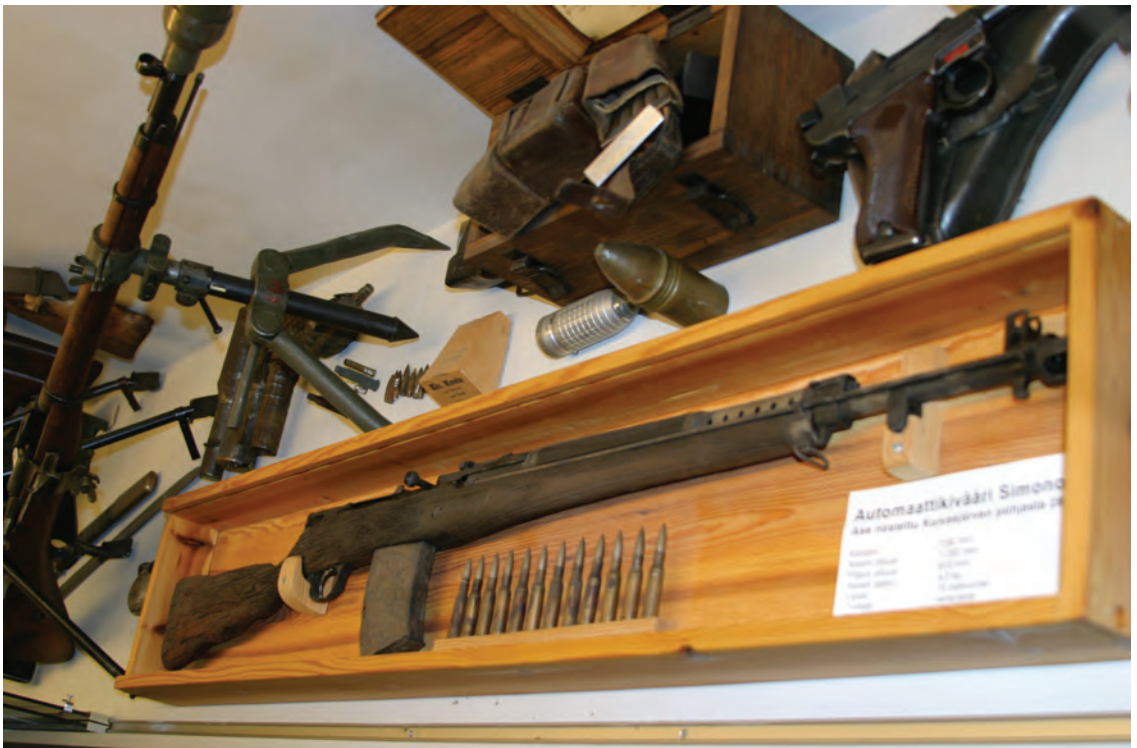
Rusiškas Simonovo automatinis šautuvas, 1995 m. įkliuvęs į žvejo tinklą Kuivasjervio ežere. Gausiai sutepto šautuvo šovinio parakas tebebuvo sausas.