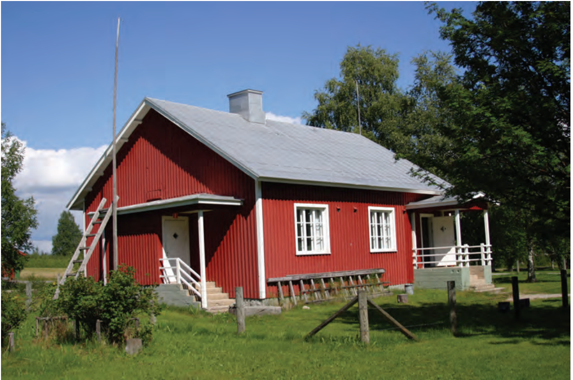
Senasis Ratės pasienio sargybos postas, kuriame dabar įrengtas muziejus.