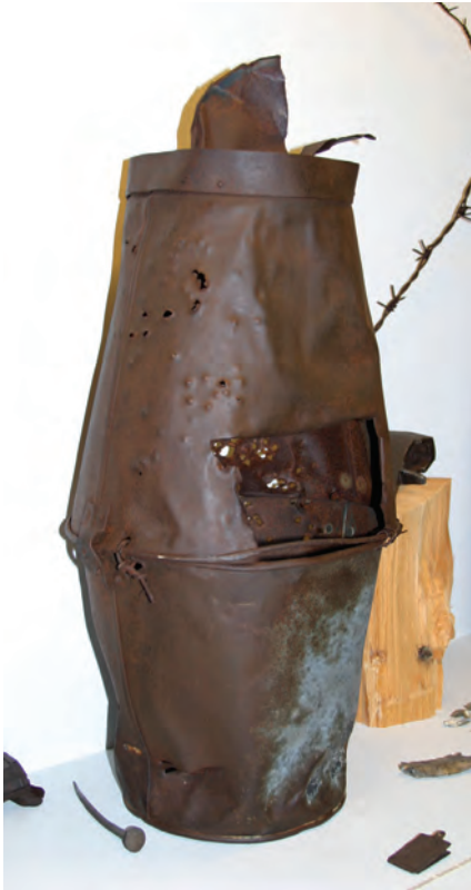
Ukrainiečiai iš cinkuotų kibirų buvo pasistatę ugniakurus. Trauką užtikrino pramuštos skylutės.