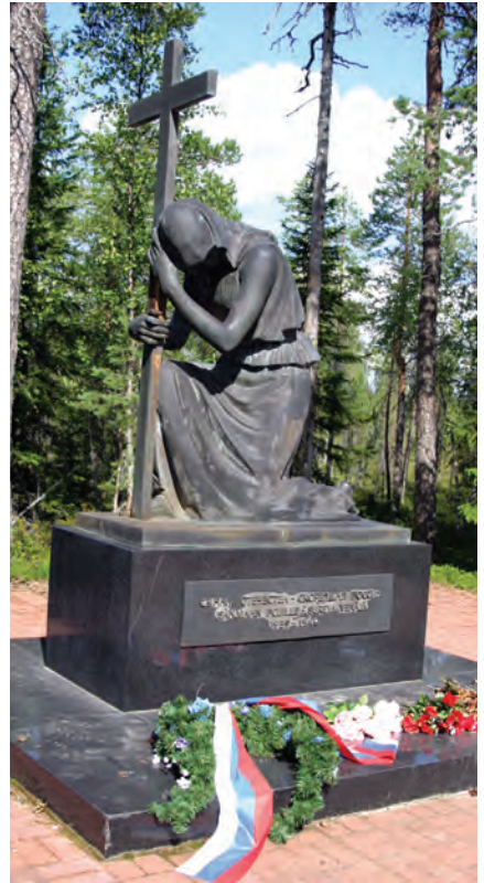
1994 m. rusai Ratės kelyje pasistatė savo paminklą.