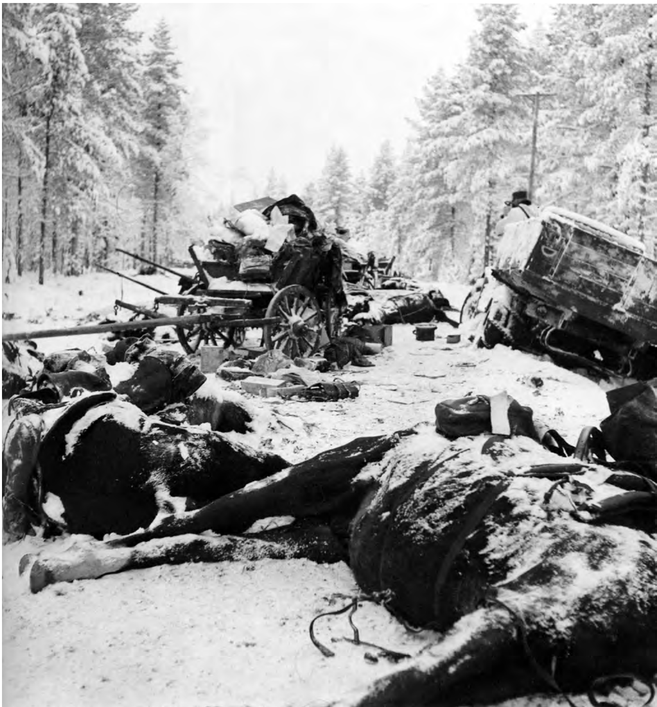
Niūrus Ratės kelio mūšio palikimas.