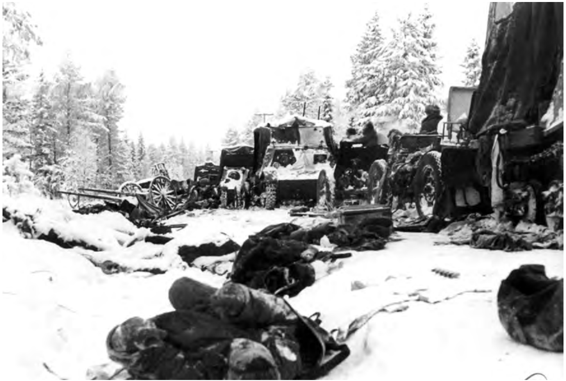
Tokios Suomusalmio nuotraukos 1940 m. sausio mėn. pasklido po visą pasaulį.