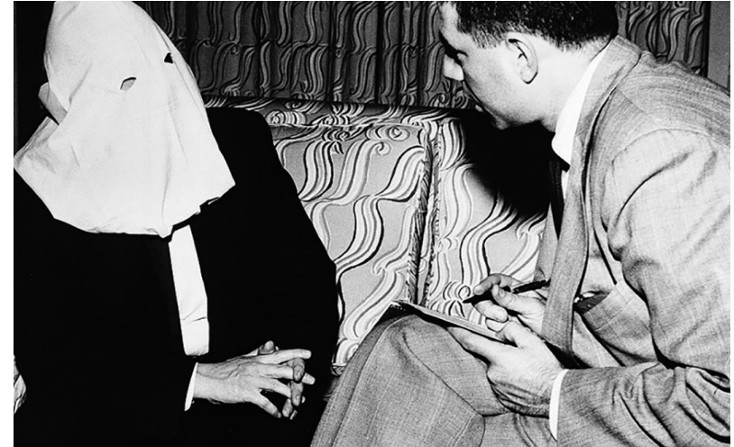
Sovietų paslaptis išdavęs I. Guzenka (su baltu gobtuvu ant galvos) bendrauja su Vakarų žurnalistu.