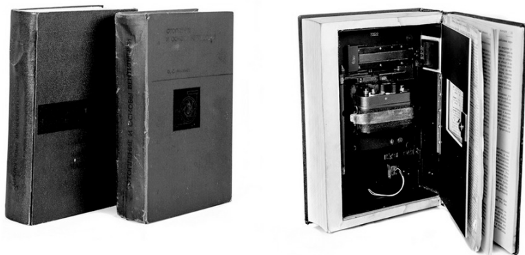
Sovietų KGB laboratorijose sukurtos knygos su įtaisyta kamera ir garsą įrašanti įranga.

Mokslas deramą dėmesį skiria ir televizijai kaip šnipinėjimo įrankiui. Žvalgybos srityje dirbantys mokslininkai sukūrė moteriško rankinuko dydžio TV kameras su įtaisytomis tranzistoriais, maitinamais klausos aparatų baterijomis. Dėl mažo dydžio jas lengva paslėpti, pavyzdžiui, lentynoje už knygų, pritvirtinant po stalu arba stalčiuje, po apatiniais drabužiais. Šiose TV kamerose įmontuoti vaizdą fiksuojantys išmanieji lęšiai, kuriuos sudaro plonas lankstus strypelis. Jį galima pakisti po durimis į užrakintą kambarį, prakišti pro rakto skylutę ir net pro siaurą sienoje iškaltą skylę. Šis lankstus strypelis, sulenktas stačiu kampu, laužia šviesą ir perduoda vaizdą. Šio tipo kameros nėra plačiai naudojamos, bet kartais jos gali agentui neįtikėtina padėti.